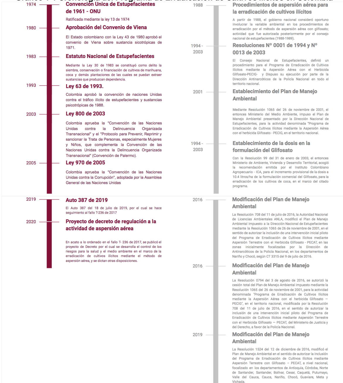
Gráfico 1-1 Cronología del Programa de Erradicación de Cultivos ilícitos en Colombia

Como se presenta en la siguiente figura, el proceso de implementación de estas acciones, atendiendo las garantías constitucionales y legales, desde su inicio ha tenido en cuenta los aspectos ambientales para la ejecución de las acciones de erradicación de cultivos ilícitos, que, por orden legal, deben ser realizadas por la Dirección Antinarcóticos de la Policía Nacional.