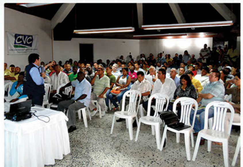
Jornada de formalización minera en el municipio de Buga.