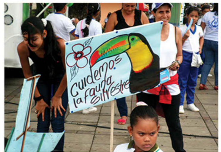
Marcha en favor de la fauna silvestre.

A pesar de los trabajos de educación ambiental que realizan los funcionarios de la CVC, y los recorridos de control y vigilancia, la cifra de decomisos en este año 2012 en los meses de enero y febrero la cifra cerró con un total de 19 especies faunísticas decomisadas a personas que