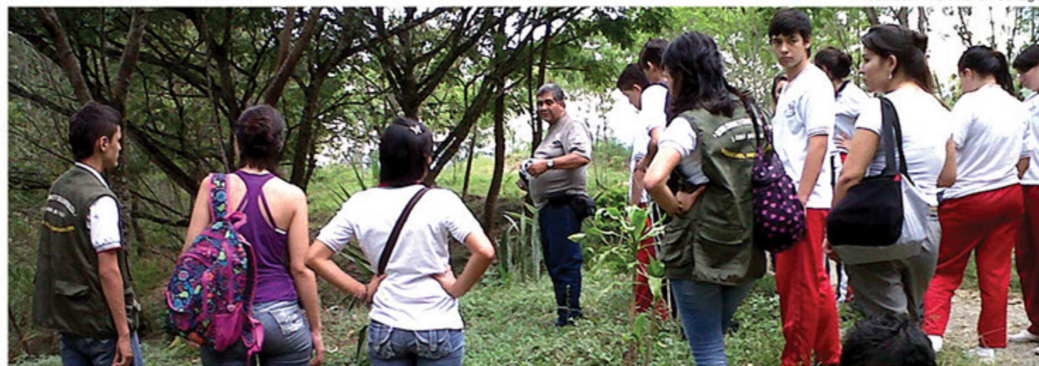
Jornada Ambiental en Cartago.