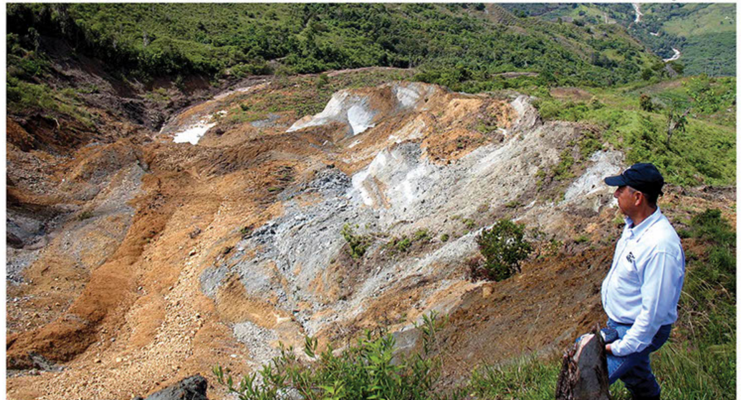
Visita Falla Los Aguacates Tuluá.

Para contribuir en la búsqueda de posibles soluciones, la Empresa de Energía del Pacífico S.A. - Epsa, presentó un estudio a cargo del ingeniero Joan M. Larrahondo, en donde por medio de fotografías comparativas, se