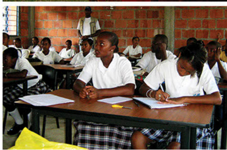
Capacitación a instituciones educativas del Pacífico vallecaucano.

Con la conformación de éstos, la actividad misional de educación ambiental de la CVC se ha fortalecido y se desea llegar el próximo año a unos 50 grupos.