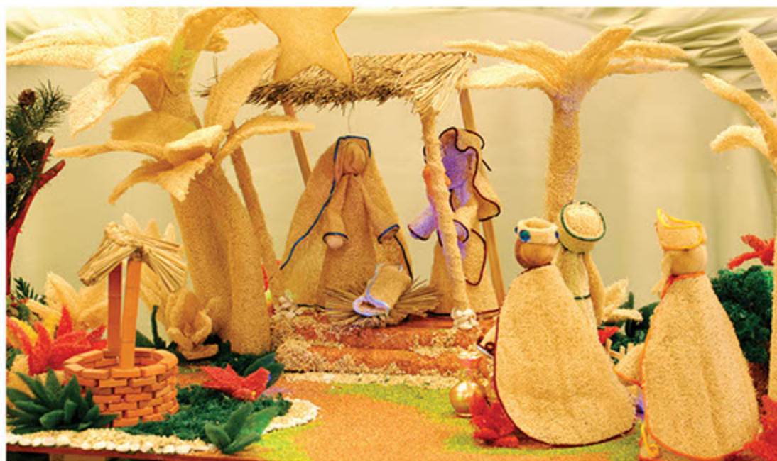
Pesebres amigables con el medio ambiente.

Entre las recomendaciones se encuentra reemplazar el musgo por el estropajo o el heno, reutilizar el papel panela, las cajas de cartón, el aserín y todo tipo de material de reciclaje para la elaboración de las casas, la gruta y los demás adornos tradicionales.