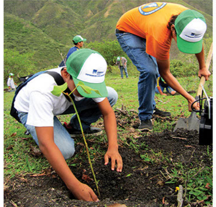
Siembra de árboles en Yumbo.