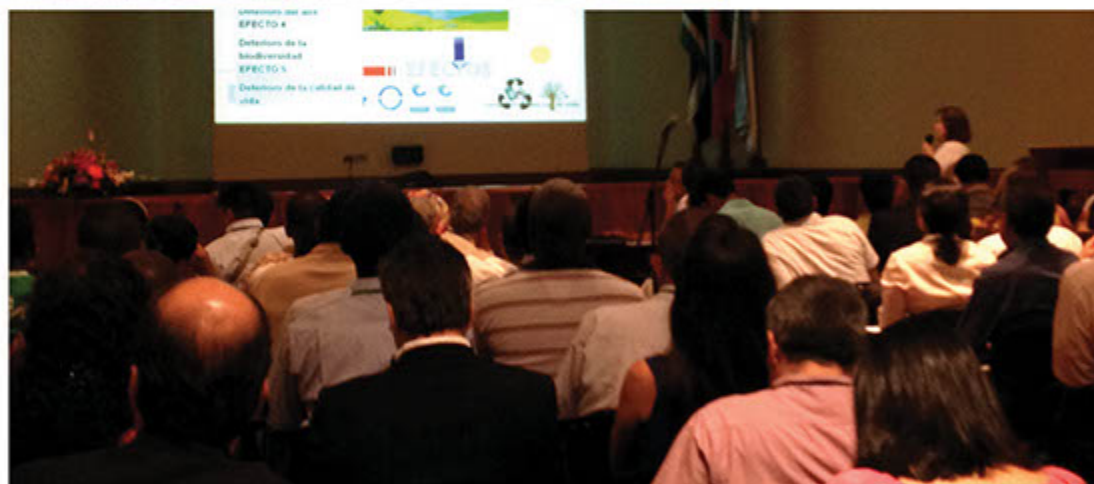
Más de 200 personas asistieron a la Audiencia del Plan de Acción 2012-2015.

"Nuestro río tutelar, el río Cauca, hay que mirarlo con especial visión, él es la suma de las bondades y los desaciertos de nuestras intervenciones, es nuestro principal río y por ello debemos