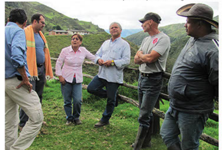
Visita de campo al Parque Natural Regional de Nima.

A corto plazo, esta iniciativa buscará desarrollar participativamente el ordenamiento ambiental de las áreas priorizadas en el Mosaico de Conservación, como aporte a la conservación de la biodiversidad, la conectividad ecosistémica y la conservación del agua. Pretende además fortalecer escenarios de gobernanza ambiental en el Mosaico que permitan un relacionamiento efectivo entre los actores públicos y las comunidades locales, organizaciones de base, ONG, actores privados, gremios y productores e implementar actividades de producción sostenible tales como sistemas silvopastoriles y agroforestales en las áreas priorizadas.