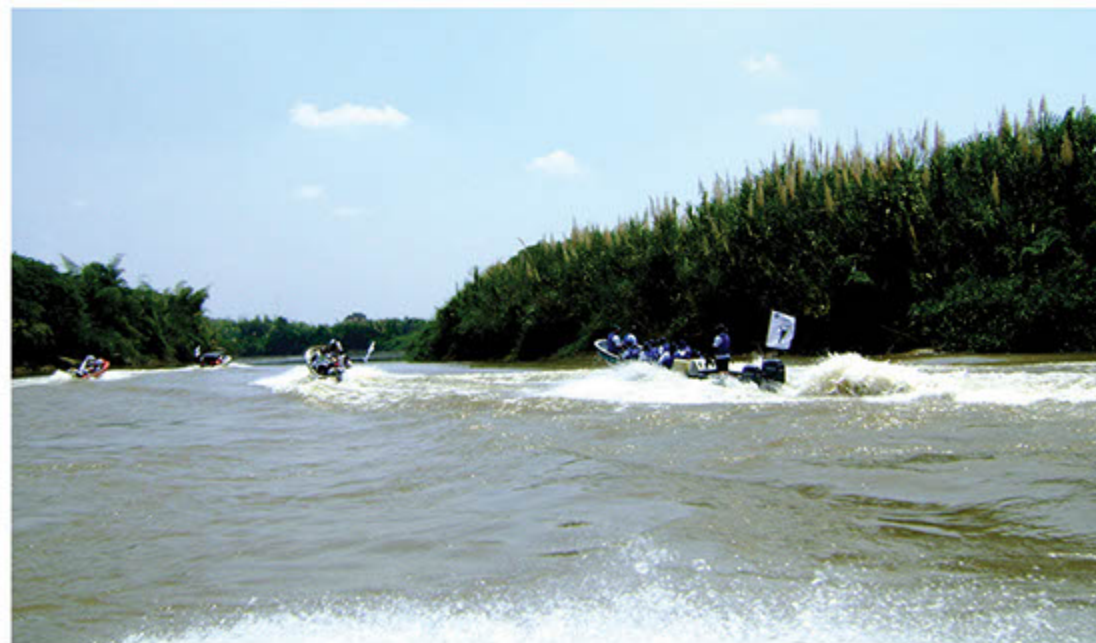
Recorrido fluvial Río Cauca.