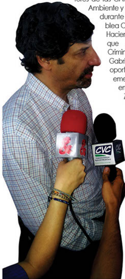
Juan Gabriel Uribe Vegalara Ministro de Ambiente y Desarrollo Sostenible.

Con la población minera del departamento, se adelantó entre el 12 y el 14 de diciembre la Jornada de Formalización Minera para el Valle del Cauca, en la que se trabajó con los pequeños mineros, asociaciones de mineros, mineros artesanales, barequeros y comunidades indígenas y negras, en la jornada en la cual funcionarios de la CVC y el Ministerio de Minas, los capacitaron en el programa de formalización minera que adelanta el Gobierno Nacional.