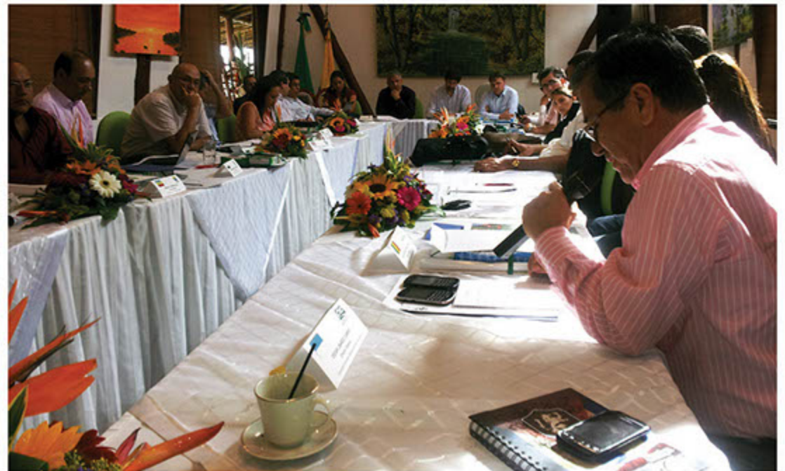
Director General de la CVC interviene en la Asamblea de Asocars en Pereira.