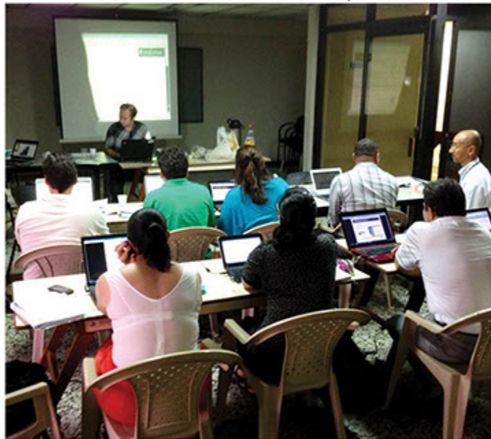
Taller de capacitación con holandeses.

El taller dictado por contratistas holandeses dentro del proyecto de cooperación Colombia y Holanda por el Agua, capacitó a funcionarios del Departamento Nacional de Planeación, el Ideam, la CAR y la CVC.