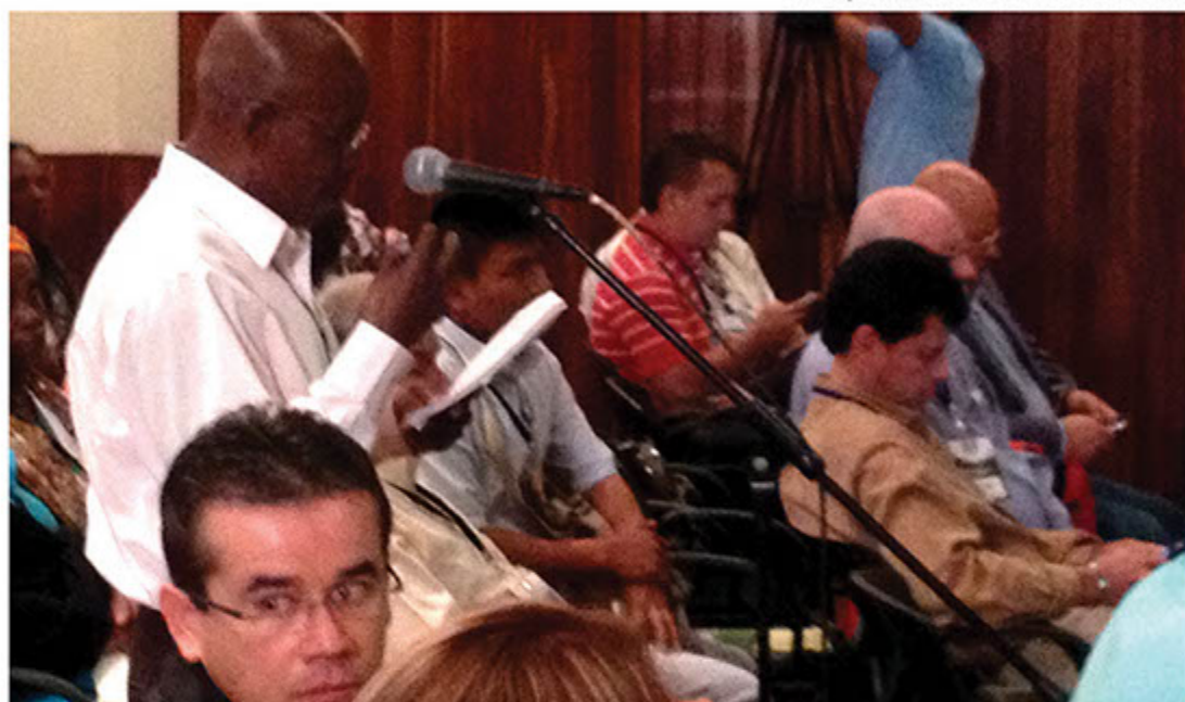
Participación ciudadana en Audiencia Pública.

Luego se dio paso a la participación de la ciudadanía con un total de 153 personas inscritas para intervenir durante casi 5 horas de audiencia; a quienes se abrieron los micrófonos para escuchar sus comentarios, propuestas y sugerencias de los representantes de la comunidad vallecaucana, entre los que