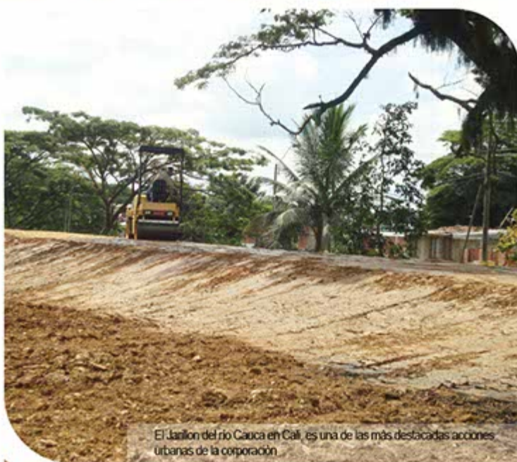
El Jardón del río Cauca en Cali, es una de las más destacadas acciones urbanas de la corporación.