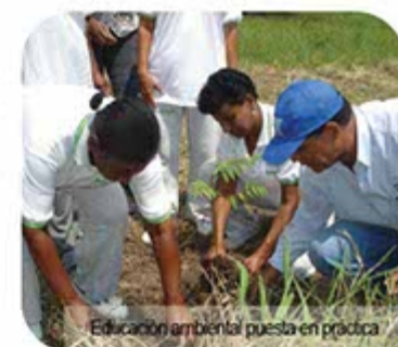
Educación ambiental puesta en práctica

Durante el 2011, la reserva forestal de San Cipriano se vio beneficiada con la construcción del Centro de Educación Ambiental, que se convirtió en punto de referencia para propios y extraños. La obra tuvo un costo de 80 millones de pesos, recursos que