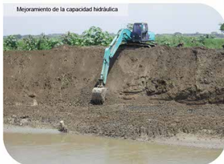
Mejoramiento de la capacidad hidráulica

En lo relacionado con planeación municipal y ambiental, se llevaron a cabo las evaluaciones y aprobaciones de los Planes Parciales de futuros desarrollos urbanos de Santa Barbara y Monte Claro en el municipio de Palmira y de Villa Elena en el municipio de Florida; así mismo se concertó y aprobó el ajuste excepcional al Plan de Ordenamiento Territorial