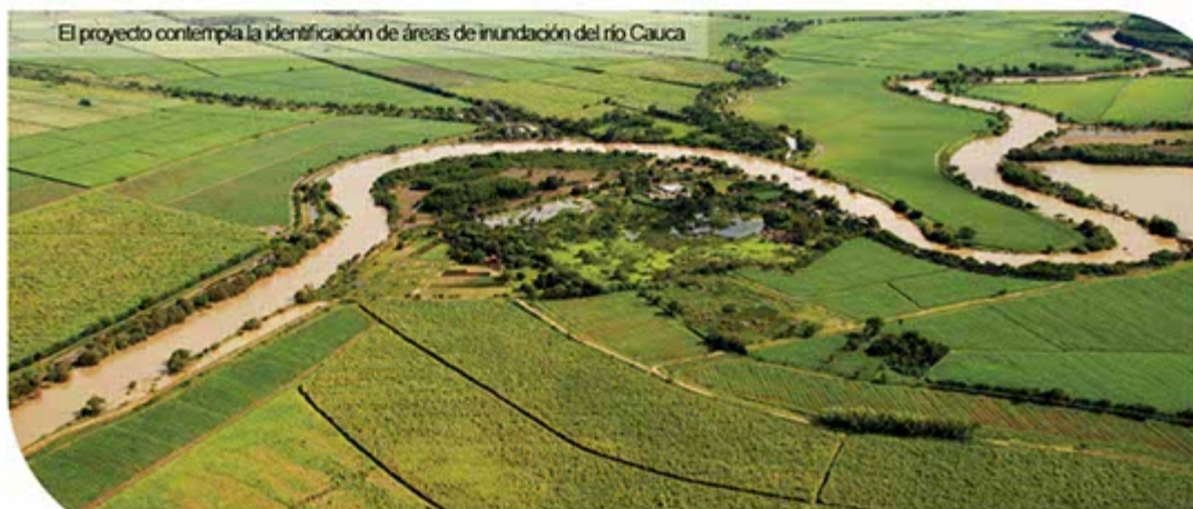
El proyecto contempla la identificación de áreas de inundación del río Cauca

Aprovechando la experticia del Gobierno holandés en el tema hídrico, la idea de la CVC es repensar en un ejercicio de planificación regional, el nuevo modelo hidrológico para la restauración, conservación y uso sostenible del río tutelar de los vallecaucanos.