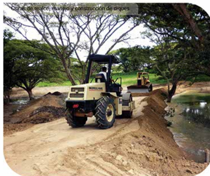
Obras de realce, manejo y construcción de diques

Con el fin de involucrar todos los actores sociales en el trabajo orientado a la protección del medio ambiente, hemos capacitado estudiantes de primaria y bachillerato, así como docentes de los planteles educativos de los nueve municipios de jurisdicción. Docentes y estudiantes de Universidades como la Antonio Nariño del municipio de Roldanillo, el