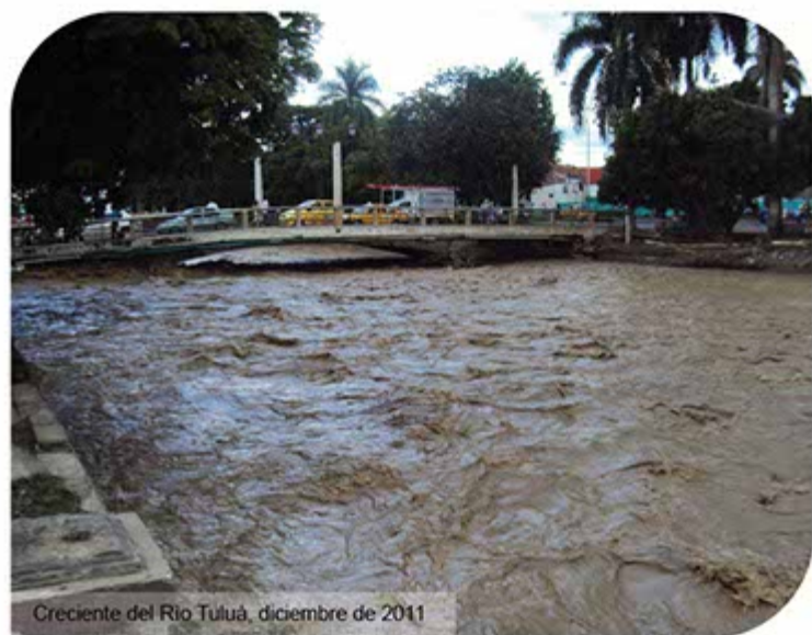
Creciente del Río Tuluá, diciembre de 2011

Otro de los temas trascendentales en el 2011 para la CVC, fue la resolución de conflictos en la cuenca del río Bugalagrande, en donde se invitaron actores de los municipios que están en jurisdicción de esta importante cuenca del Centro del Valle.