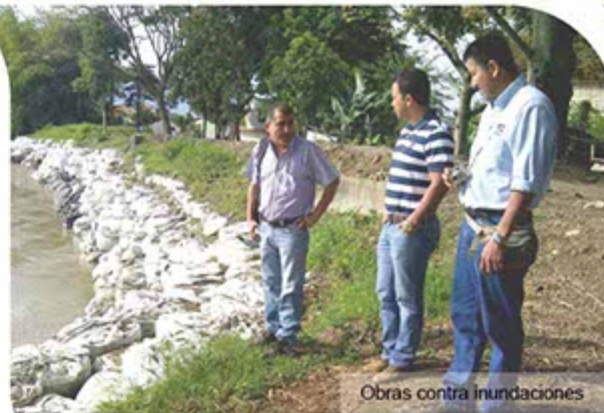
Obras contra inundaciones