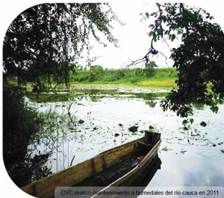
CVC realizó mantenimiento a humedales del río cauca en 2011