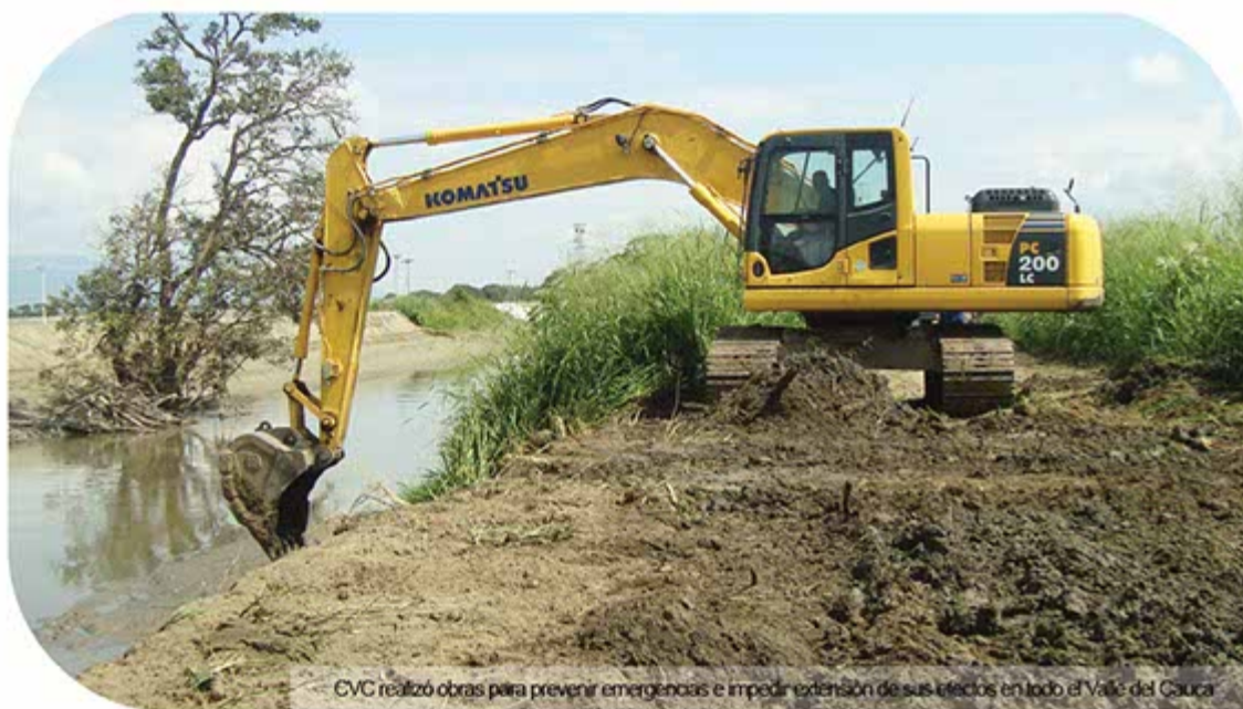
CVC realizó obras para prevenir emergencias e impedir extensión de sus efectos en todo el Valle del Cauca

“Señales de Vida” fue un proyecto adelantado también en la Sultana del Valle con actividades orientadas a la consolidación de los Comités y Comisiones Ambientales, lo que permitió capacitar, a través de un diplomado a más de 450 participantes en “Cultura Ambiental Ciudadana y Gestión Ambiental Participativa”; además se realizó la recuperación de espacios verdes y se diseñó material didáctico como apoyo a las actividades curriculares de las instituciones educativas. Así mismo, se agotó la primera fase de la formulación de las Agendas Ambientales de