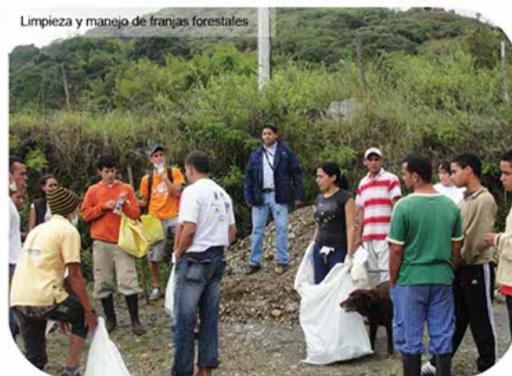
Limpieza y manejo de franjas forestales

del municipio de Palmira que incluyó temas relacionados con la gestión del riesgo.