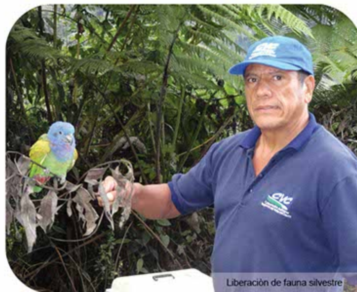
Liberación de fauna silvestre

La Dirección Ambiental Regional Centro Norte de la CVC, durante el 2011 trabajó activamente con los Comités Locales para la Prevención y Atención de Emergencias Clopad. Así mismo, realizó la descolmatación del Río Morales a la altura del corregimiento El Salto y apoyó la resolución de conflictos con las mesas de los ríos Tuluá, Bugalagrande y El Salto.