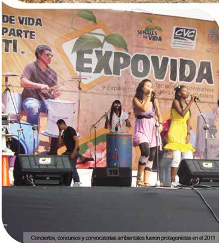
Conciertos, concursos y convocatorias ambientales fueron protagonistas en el 2011

la ciudad, la cual consistió en la caracterización ambiental de las cinco zonas de la ciudad, con sus respectivos perfiles