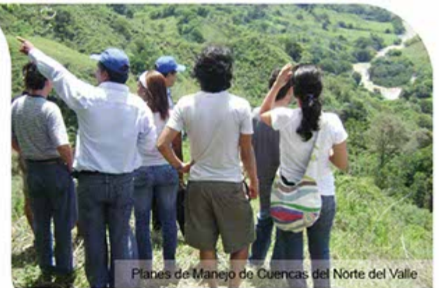
Planes de Manejo de Cuencas del Norte del Valle

Con una inversión de 7.303 millones 714 mil pesos la regional Norte de la CVC, optimizó la calidad medioambiental del territorio y fortaleció la educación y la cultura ambiental en los municipios de Cartago, Ansermanuevo, Argelia, El Águila, El Cairo, Alcalá y Ulloa, en el 2011.