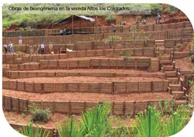
Obras de bioingeniería en la vereda Altos los Colorados

Proyectos de reforestación, bioingeniería, seguimientos a licencias ambientales, y la comunicación permanente con los Comités Locales de Emergencia – Clopad entre otros, fueron unas de las intervenciones que realizó la CVC DAR Pacífico Este, en los municipios de Dagua, La Cumbre y Restrepo en lo que correspondió al año 2011.