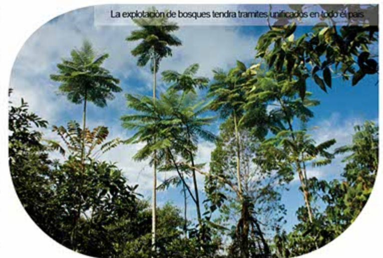
La explotación de bosques tendrá trámites unificados en todo el país.

Además de regular el aprovechamiento del recurso bosque, tiene como fortaleza que unifica los trámites en relación a las