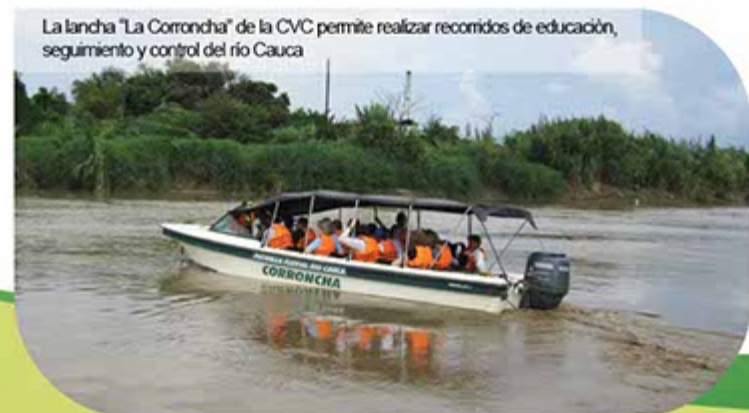
La lancha “La Coroncha” de la CVC permite realizar recorridos de educación, seguimiento y control del río Cauca

Los recursos aportados por Colombia Humanitaria en el Valle permitieron la descolmatación de cauces y recuperación de diques los ríos Bolo, Frayle, Morales, Toro y Guabas, así como en los zanjones Mojahuevos, Lavapatatas y Torfugas.