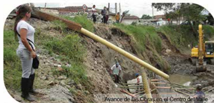
Avance de las Obras en el Centro del Valle

La DAR Centro Sur cuenta dentro del área de su jurisdicción con los dos únicos rellenos sanitarios del departamento con licencia ambiental, ubicados en los municipios de Yotoco (relleno Sanitario Colomba – El Guabal) y San Pedro (relleno Sanitario Presidente), con lo cual se garantiza la accesibilidad de los municipios del área de influencia a sitios autorizados para la disposición final de residuos sólidos. Aunque estos proyectos son objeto de seguimiento y control de manera directa por parte del Grupo de Licencias Ambientales, la Regional tiene a su cargo la facultad sancionatoria, fue así, como durante el año 2011, a partir de los informes y conceptos emitidos por el grupo de licencias ambientales se iniciaron procesos sancionatorios formulando cargos en contra de los rellenos sanitarios por el incumplimiento de las obligaciones establecidas en las licencias ambientales otor-