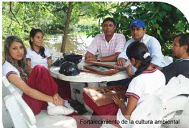
Fortalecimiento de la cultura ambiental