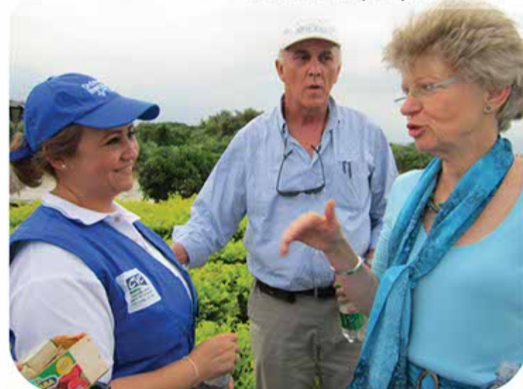
Directora de la CVC y Embajadora de Holanda

Al final del proceso la región contará con el diseño de una red de alertas tempranas asesorada por expertos holandeses, la cual facilitará la vigilancia y aviso de los cambios y fenómenos que se presenten en el río y que tengan repercusión en poblaciones aguas abajo.