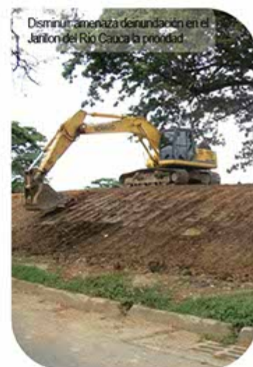
Disminuir amenaza de inundación en el Jarillón del Río Cauca la prioridad

La DAR entrega un balance satisfactorio que es a la vez un compromiso en el 2012, mantener y aún mejorar su trabajo por el medio ambiente y los habitantes del Valle.