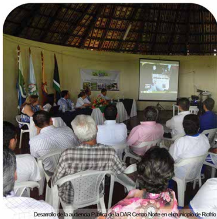
Desarrollo de la audiencia Pública de la DAR Centro Norte en el municipio de Riofrio

Los vallecaucanos tuvieron la oportunidad de pedir explicaciones a los servidores públicos de la CVC sobre sus actuaciones en el territorio. Las Audiencias Públicas Ambientales correspondieron al seguimiento al Plan de Acción 2007-2011 y rendición de cuentas a la ciudadanía vallecaucana gestión 2011.