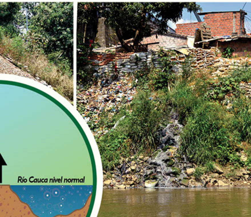
Escorrentías y actividades productivas.