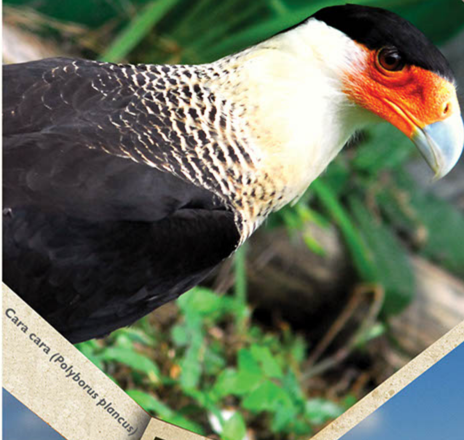
Cara cara ( Polyborus plancus )