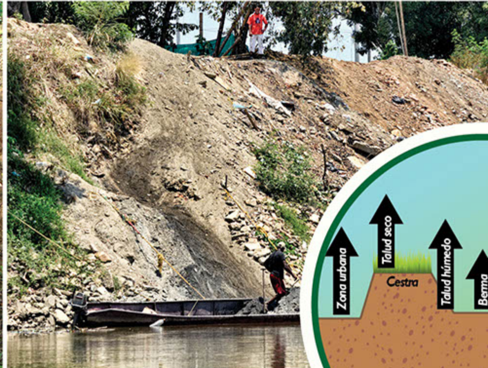
Disposición de escombros.

del jarillón para aumentar la protección de la ciudad. Entre las medias contempladas a corto plazo, están la recuperación inmediata de 3500 mts de dique que están por debajo del nivel de protección, suspender la disposición de escombros, combatir la hormiga arriera, construir pendientes menos empinadas, la conformación de un plan de inspección, mantenimiento y vigilancia, así como despejar áreas invadidas que han debilitado la función del jarillón.