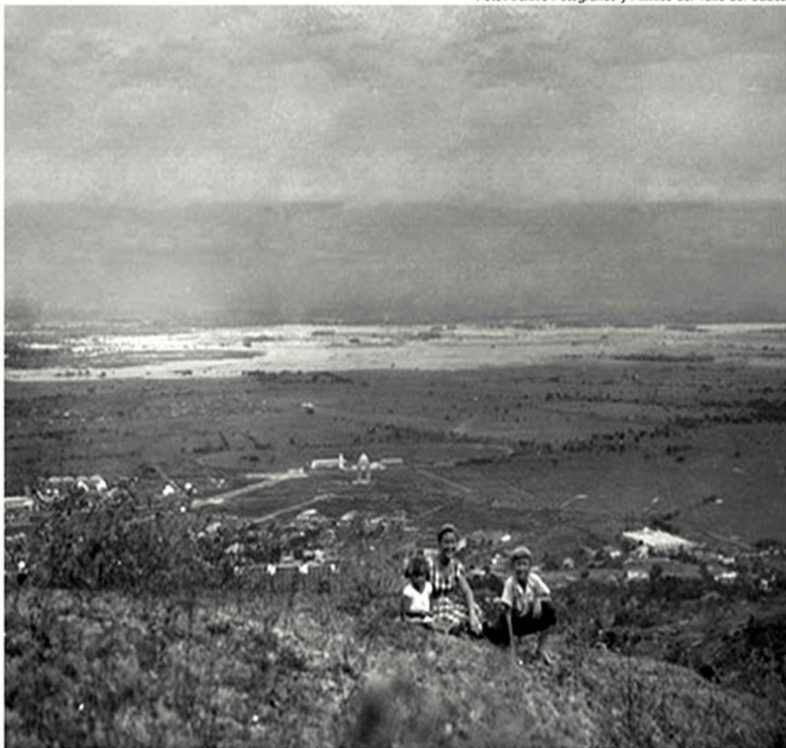
Vista desde los cerros de Cali, del área de inundación en 1950 de lo que hoy es el distrito de Aguablanca.

"El último registro cartográfico de las inundaciones históricas de Cali solo llega hasta el año 1950, desde esa época nunca más la ciudad se volvió a inundar porque la siguiente gran inundación fue del año 1964 cuando ya existía el jarillón y Cali no se vio afectada en esa ocasión" resaltó el ingeniero civil de la CVC Chaves.