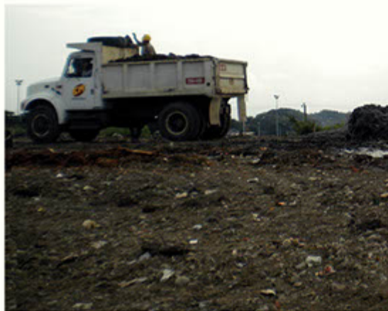
Los lodos eran llevados por volquetas a razón de 350m 2 al día.

Se proyecta que este lote sea un parque educativo.