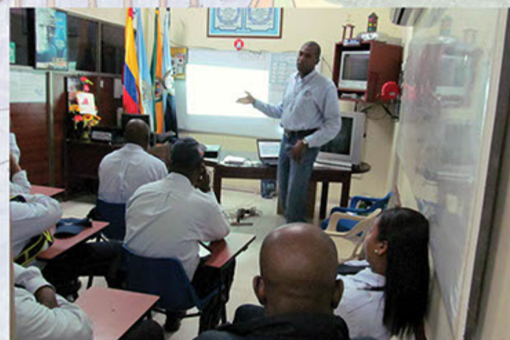
Capacitación guardas de tránsito.

Para lo que resta del presente año, el comité continuará con operativos a las fuentes móviles como taxis, colectivos y perifoneadores, así como el monitoreo y control a establecimientos nocturnos como bares, cantinas, miradores y fuentes de soda ubicadas en la zona rosa de la ciudad y el punto crítico de Sanadresito, además de visitar barrios con el acompañamiento de los miembros de las JAC Y JAL como Juan 23, Bellavista, Independencia y Cascajal considerados como unos de los sectores más bulliciosos de la localidad.