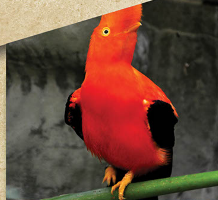
Gallito de roca ( Rupicola peruviana )

Actividades humanas, la caza indiscriminada, la tala de bosques y la ampliación de la frontera agrícola, entre otros, son factores que alteran el hábitat de las aves presionando su conservación y amenaza. Por eso en la CVC se han elaborado los Planes de Manejo para 14 especies focales de aves del departamento.