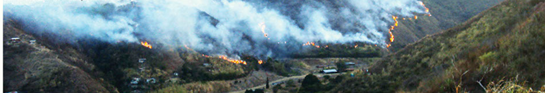
Quemas en el sector de El Cabuyal Cali.