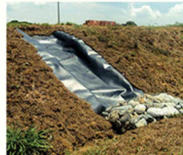
Detalle torrenteras. Las piedras enmalladas disipan la energía del agua.

En el barrio Puertas del Sol al oriente de Cali y contiguo a la planta de tratamiento de Puerto Mallarino y al reservorio de agua de Emcali existe un lote en el que se arrojaban los lodos provenientes de canales de aguas lluvias, alcantarillas y la Ptar de Cañaveralejo. Por supuesto, esta actividad generaba un enorme impacto ambiental.