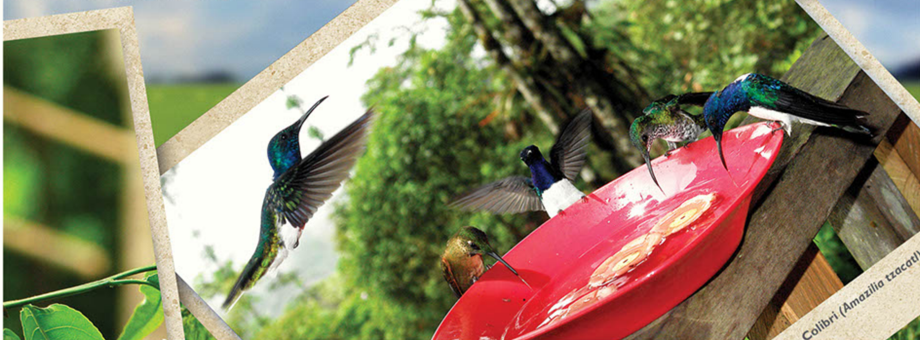
Colibri ( Amazilia tzacoti )