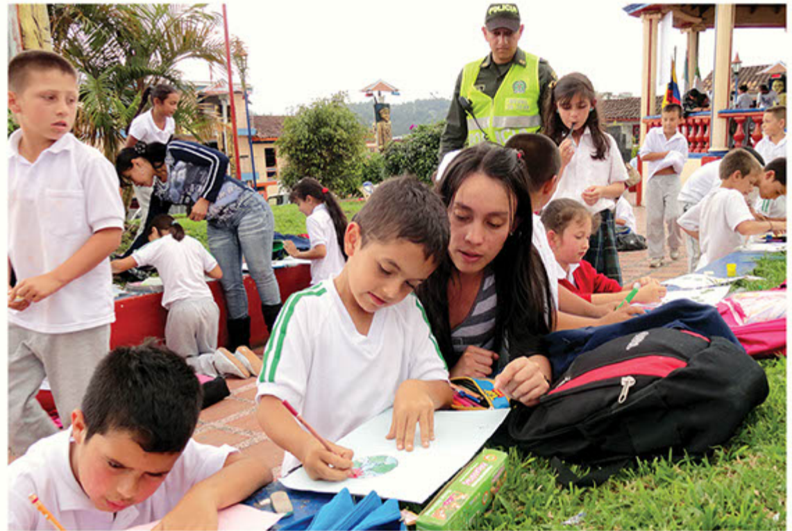
La primera infancia de Versalles le apuesta a la educación ambiental.

Para la Dirección Ambiental Regional Brut de la CVC es de gran satisfacción ver cómo los niños y jóvenes de Versalles no solo comienzan a interesarse, sino que