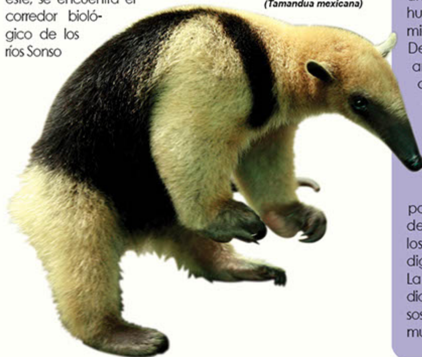
Oso hormiguero ( Tamandua mexicana )