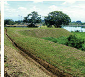
Primer plano canaletas, al fondo reservorio de EMCALI.

lluvia para entregarlos de forma paulatina a los sumideros y cámaras del sector.