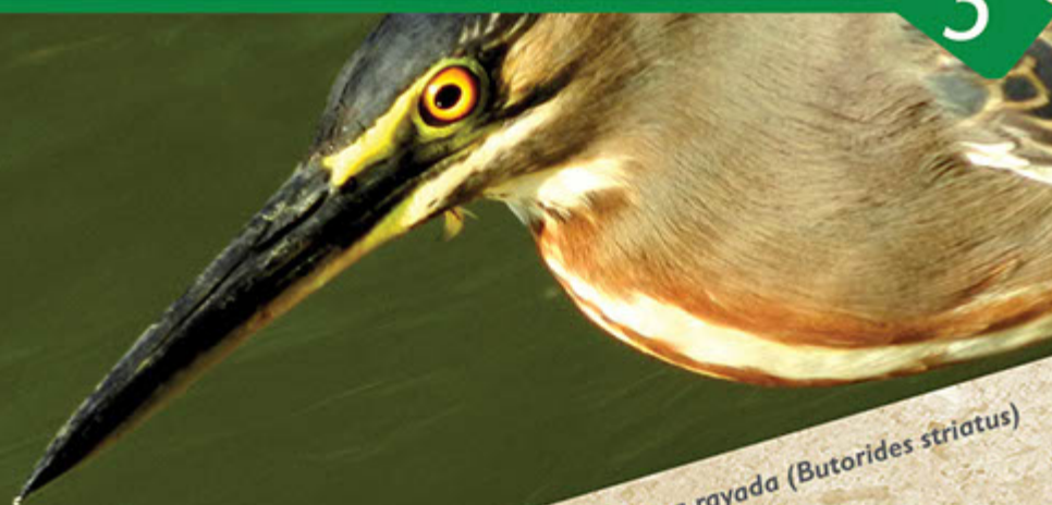
Garza rayada ( Butorides striatus )