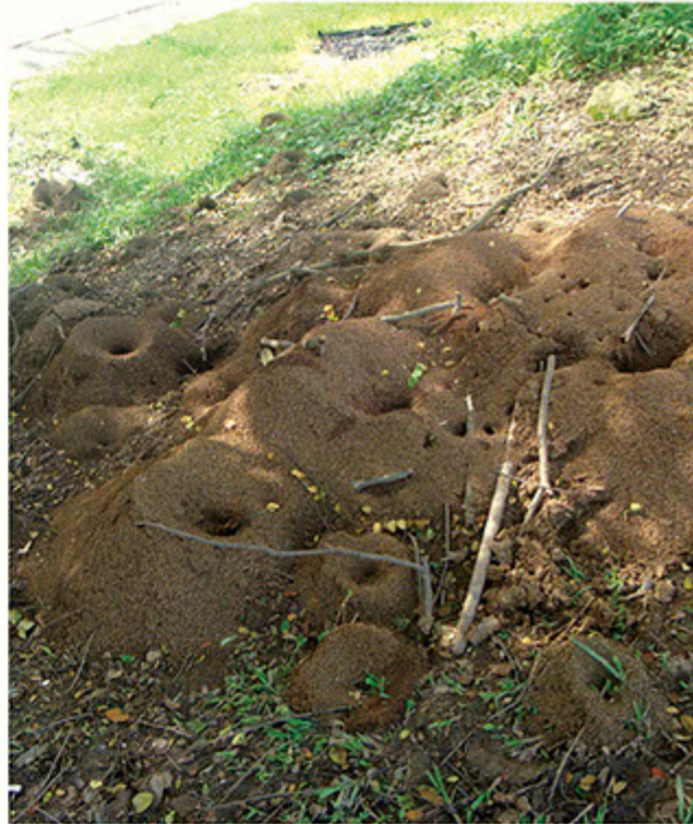
Cavernas de hormiga arriera.

El informe recomienda a corto plazo ocho medidas inmediatas para recuperar los tramos críticos y medidas a largo plazo como elevar el nivel de la corona