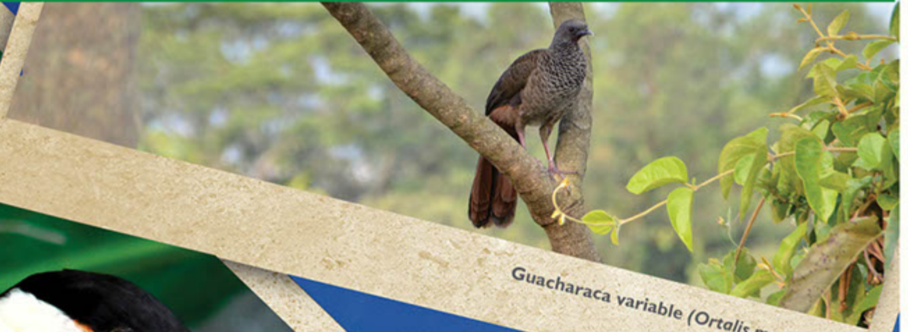
Guacharaca variable ( Ortalis motmot )

Se ha incrementado el avistamiento de individuos de algunas especies amenazadas como el Buitre de Ciénaga, el Gallito de Roca, la Pava Caucana, la Bangsia Negra y el Tucán Piquinegro, así como reducción en la presencia de la Perdiz Colorada y la Pava del Baudó. CVC celebrará el mes de las aves con actividades lúdico ambientales y dos salidas de avistamiento de aves.