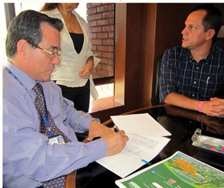
Firma del convenio para construcción de la segunda fase de la Ptar de Tuluá.

Tuluá, junto a Jamundí, Pradera, Candelaria, Florida, Buga, Palmira y Yumbo y por supuesto Cali, son responsables de más del 90% de la carga orgánica arrojada al río Cauca a su paso por el Valle, por esto es indispensable dar prioridad a las obras de alcantarillado y tratamiento