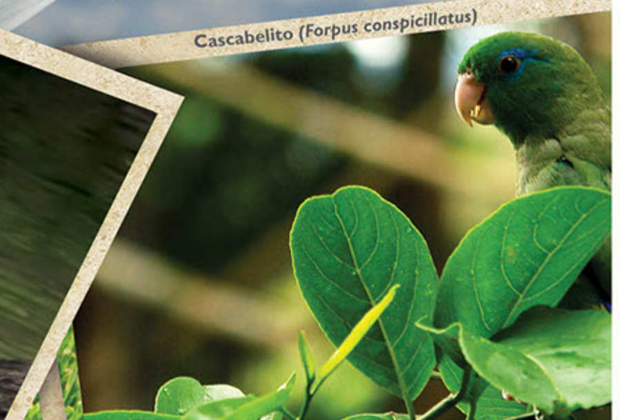
Cascabelito ( Forpus conspicillatus )