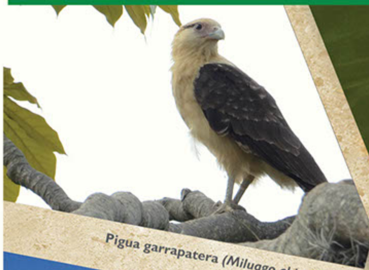
Pigua garrapatera ( Miluago chimochina )