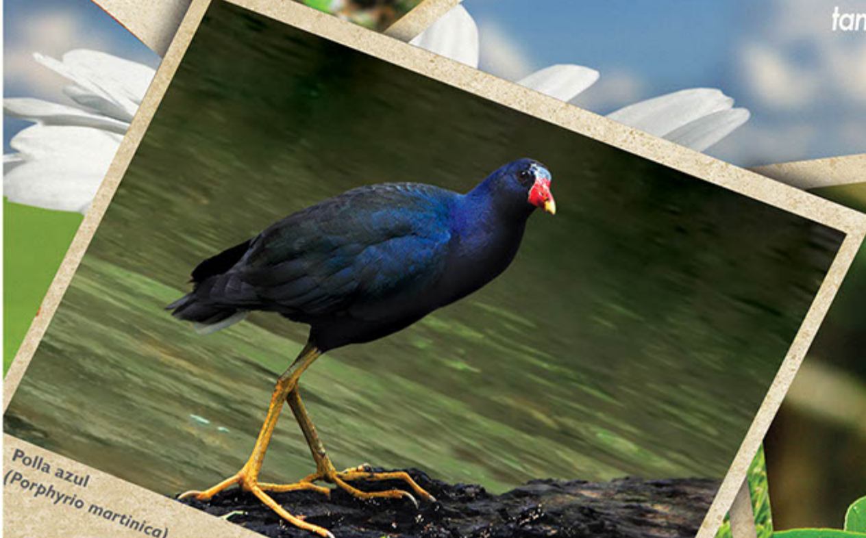
Polla azul ( Porphyrio martinica )

Se ha incrementado el avistamiento de individuos de algunas especies amenazadas como el Buitre de Ciénaga, el Gallito de Roca, la Pava Caucana, la Bangsia Negra y el Tucán Piquinegro, así como reducción en la presencia de la Perdiz Colorada y la Pava del Baudó. CVC celebrará el mes de las aves con actividades lúdico ambientales y dos salidas de avistamiento de aves.