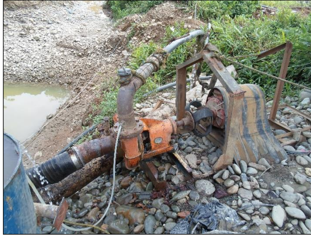
Foto N° 3. Motobomba utilizada para la captación del recurso hídrico.

Objeciones: No se presentó durante la visita ninguna objeción de terceros por el trámite adelantado por la CVC para el otorgamiento de la Concesión de aguas superficiales.