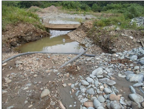
Foto N° 1. Ubicación manguera para captación del recurso en la fuente hídrica.

Que mediante oficio 0750-17536-04-2015 del 29 de julio del 2015, se informa al usuario de la práctica de visita ocular de profesional especializado a fin de determinar la viabilidad del otorgamiento de la Concesión de aguas superficiales para el abastecimiento del recurso hídrico a la planta trituradora ubicada en el Corregimiento de Córdoba, a través de la fuente superficial del río Dagua.