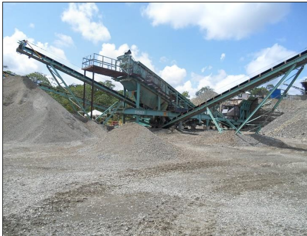
Foto N° 2. Planta trituradora que se abastece del recurso hídrico.

De acuerdo con la información aportada por la persona encargada de atender la visita el mantenimiento del sistema consiste básicamente en la limpieza permanente de las mangueras y en la verificación constante del estado de la motomba utilizada para la conducción del recurso hídrico a la planta trituradora.