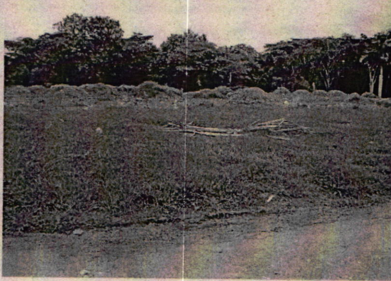
FOTOS DEL JARILLON -RIO MORLAES

Corporación Autónoma Regional del Valle del Cauca