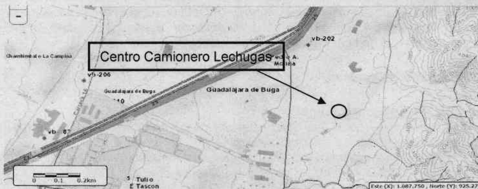
Imagen No. 1. Se observa la ubicación del predio Centro Camionero Lechugas sin ningún pozo registrado ante la CVC.

En este sentido se debe considerar que a la fecha no se ha emitido acto administrativo alguno otorgando la concesión de aguas subterráneas, ya que como se indica en la documentación contenida en el expediente, se requirió documentación completaria que no fue presentada, en consecuencia, en la actualidad, se está realizando un uso de las aguas subterráneas sin contar con la concesión por parte de la CVC. Lo anterior, se verificó mediante consulta a la aplicación GEOVC.