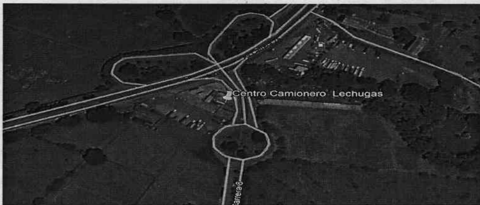
Ilustración 1. Ubicación del predio visualizado a través de Google Earth.