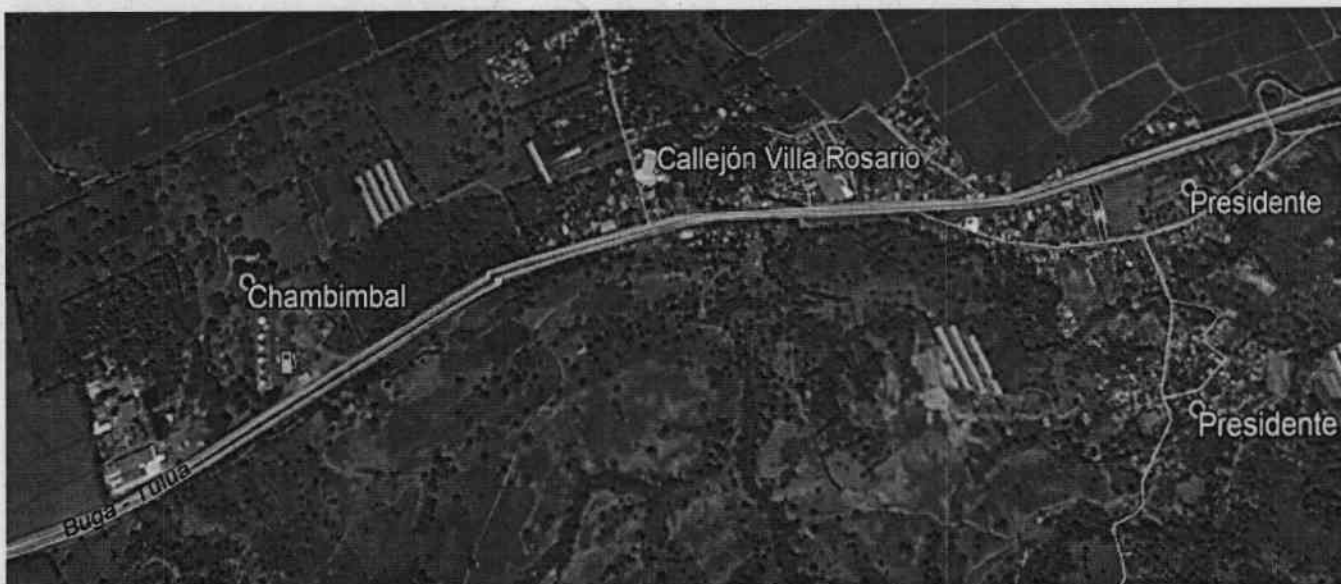
Imagen 1. Ubicación de la zona visualizada a través de Google Earth

Localización: Viviendas del Callejón Villa Rosario construidas sobre y a los márgenes de la acequia Chambimbal, Corregimiento de Chambimbal San Antonio, Municipio de Guadalajara de Buga, Departamento del Valle del Cauca.