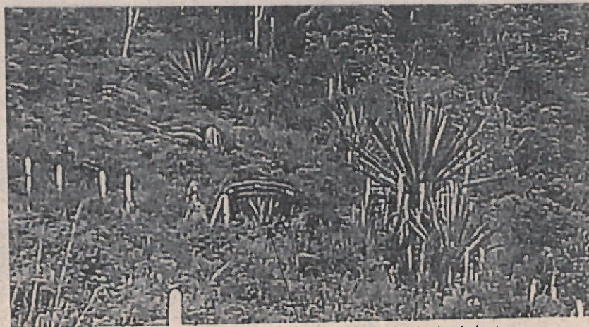
Fotografía 3. Tanque de almacenamiento instalado.