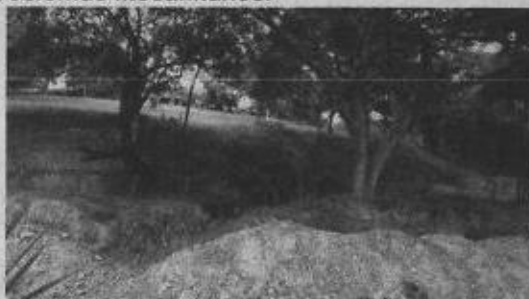
Foto1: lote donde se efectuó la actividad pasta cicatrizante

Se procedió a ingresar al lote con la autorización del señor Oscar Montoya, para verificar la severidad de las podas, ya en el lote se evidenció tres (3) tocones de especies arbóreas con diámetro que oscilaba entre 12 y 15 centímetros, posiblemente erradicados recientemente, además se observó desmoche de la copa aérea dos árboles, dejando únicamente solo el tallo principal. Por último, se contabilizaron ocho (8) arboles con podas moderadas a severas de ramas laterales. Los árboles en su mayoría no evidenciaban problemas fitosanitarios ni presentaban condición de riesgo. Se evidencia también que no se tuvieron en cuenta condiciones técnicas apropiadas en la realización de la actividad, ya que los cortes fueron realizados de una forma irregular (machete) y no se utilizó pasta cicatrizante para evitar problemas fitosanitarios.