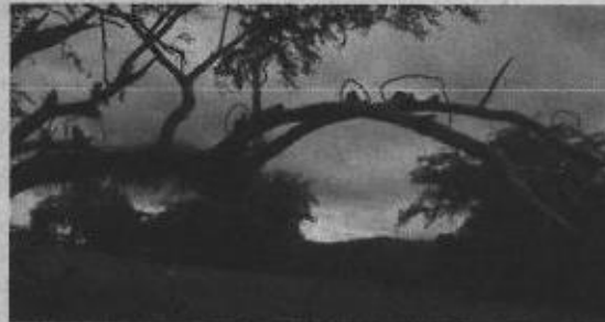
Foto2: poda severa con cortes irregulares y sin