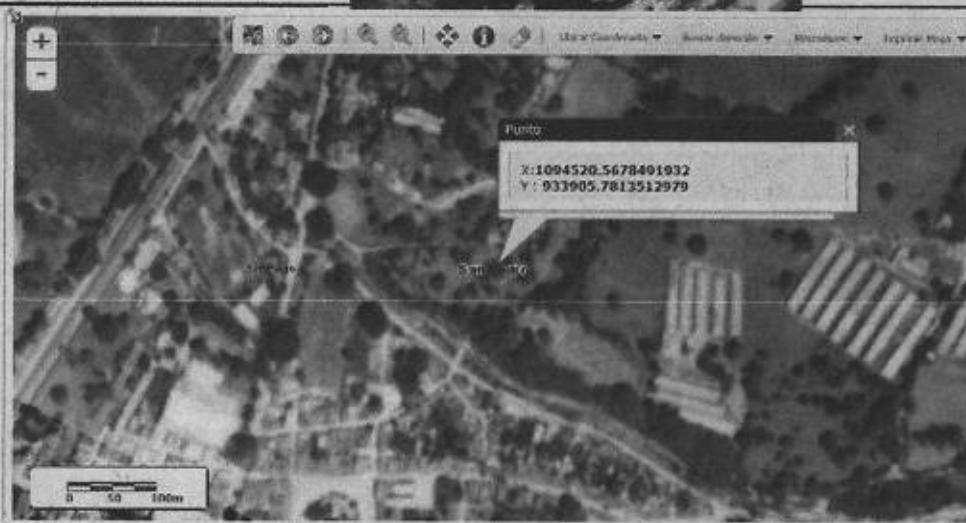
Imagen 1: ubicación del predio (GEOCVC).