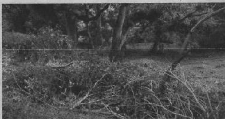
Foto 8: Material vegetal resultante la erradicación, desmoche y podas de especies arbóreas.

7. Actuaciones: Se realizó recorrido al lote donde se cometió la infracción, se tomaron coordenadas, diámetro de los tocones y registros fotográficos. No se elaboró control de visita porque el señor Oscar Montoya manifestó que no firmaba, ni recibía ningún documento.