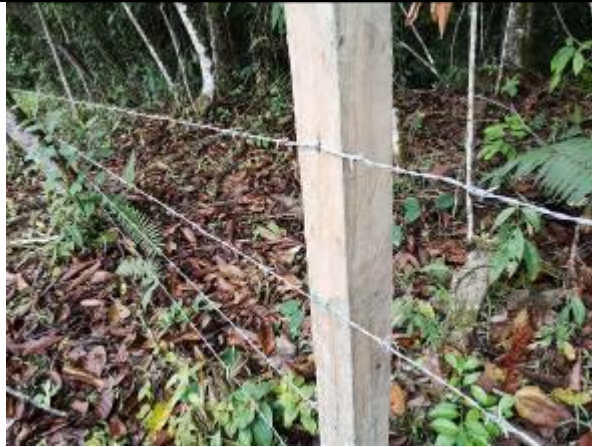
Foto No. 1. Postes a filo de lindero.