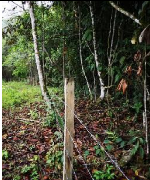
Foto No. 2. Postes en lindero cercanos a una barrera viva.