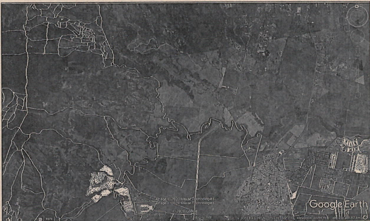
Imagen sector Chontaduro – municipio de Jamundí