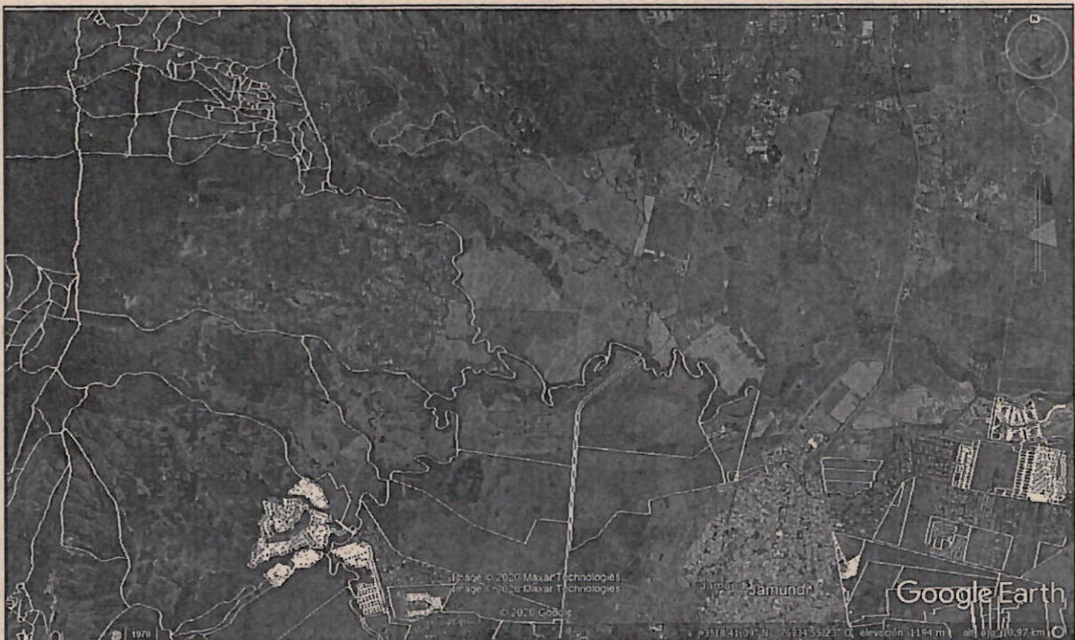
Imagen sector Chontaduro – municipio de Jamundí