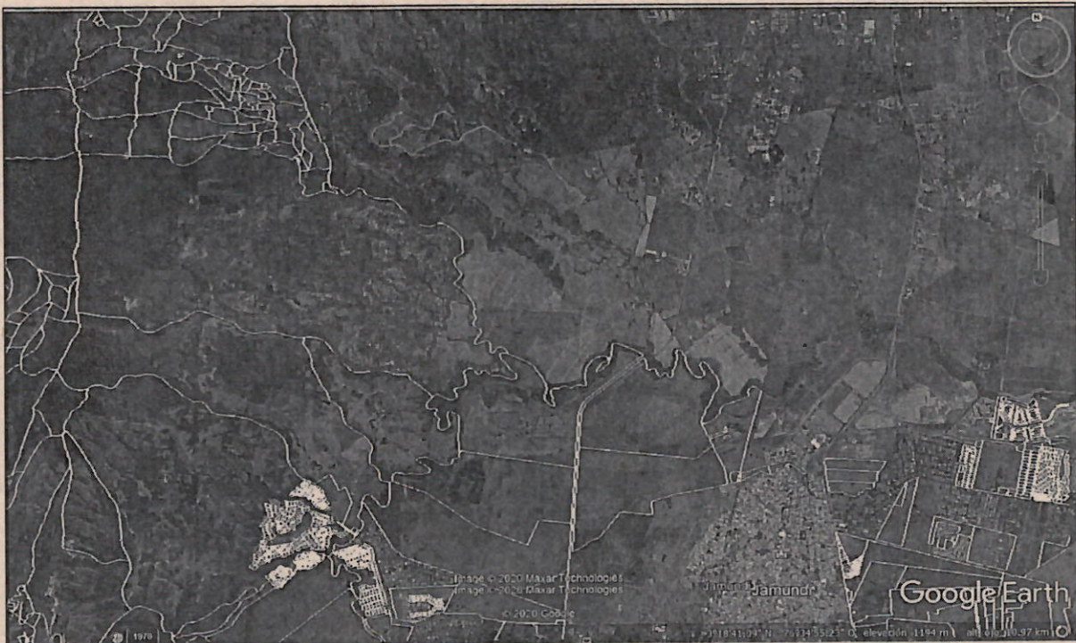
Imagen sector Chontaduro – municipio de Jamundí