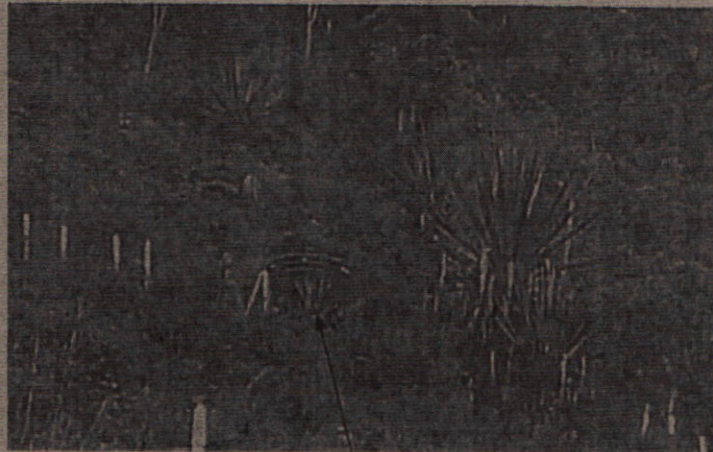
Fotografía 3. Tanque de almacenamiento instalado

Artículo Primero de la misma Resolución DAR PE No 0760 - 000410 del 23 de noviembre de 2011, en donde se estipula "USOS DE LA CONCESIÓN. Doméstico para una vivienda y agrícola para riego de una huerta casera".