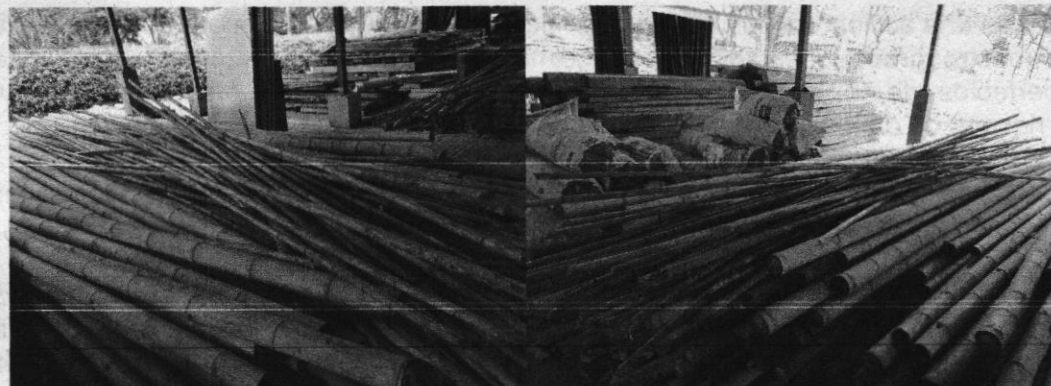
Figuras 1 y 2. Caña Brava dispuesta en CAV de Flora DAR Centro Sur.