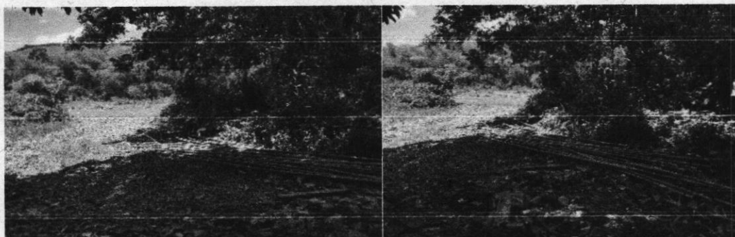
Foto 1. Y Foto 2. Aprovechamiento de material forestal en zona de protección del río

De acuerdo con la información suministrada, se establece que la actividad estaba siendo desarrollada dentro de la franja forestal protectora del río Riofrio, sin los debidos permisos ni asistencia técnica por parte de CVC. En cuanto a la especie se puede afirmar que es una especie nativa que no se encuentran vedada a nivel Nacional o Regional según normatividad vigente y tampoco registran grado de amenazada según la Resolución 1912 de 2017; esta especie es usada principalmente para la realización de artesanías y complementos en el sector de la construcción, así mismo una de sus funciones principales es el control de la erosión, En cuanto a la cantidad de material forestal aprovechado 45 unidades y la extensión del área afectada, no se puede concluir que existe daño ambiental.