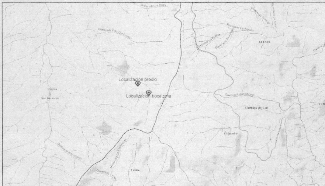
Figura 1. Localización predio y bocatoma.

Corregimiento de San Bernardo, Municipio de Dagua, Valle del Cauca, Coordenadas Planas Magna Colombia Oeste 1.049.605 Este (x), 878.460 Norte (y).