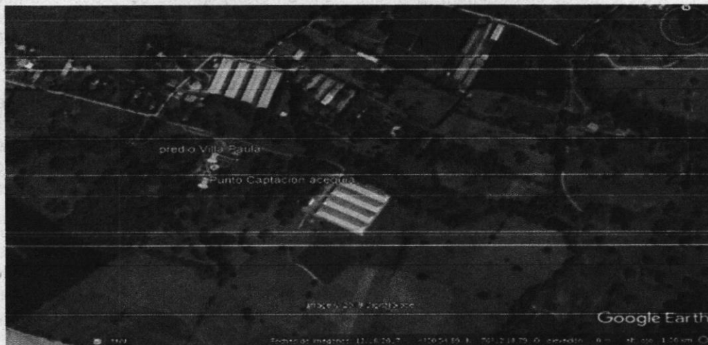
Imagen 1: Ubicación de predio Villa Paula y sitio de captación (Google Earth)