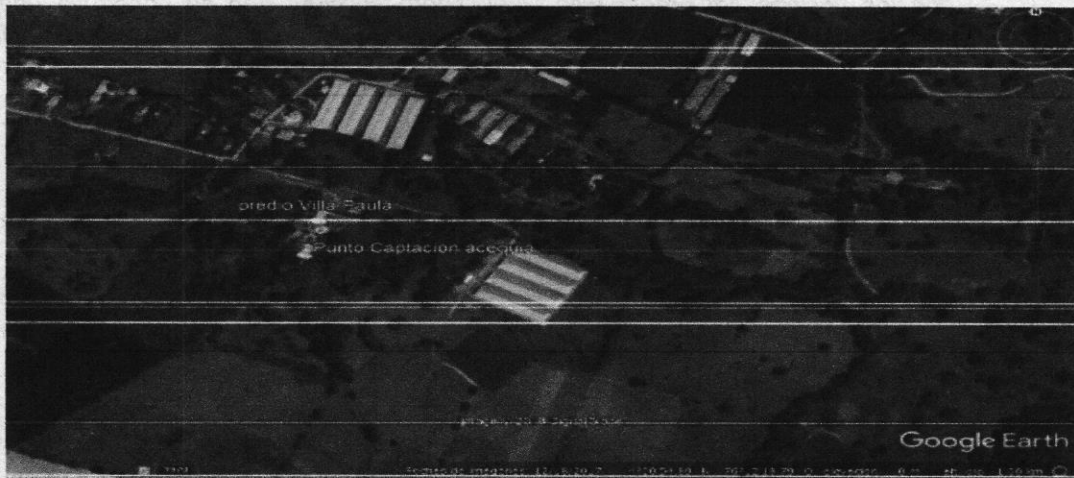
Imagen 1: Ubicación de predio y sitio de captación (Google Earth)

4. LOCALIZACIÓN: Predio Villa Paula Corregimiento Los Chancos, Municipio San Pedro, Valle del Cauca. Numero matrícula 373-107790. Coordenada N 4°0'57.09" W 76°12' 18.18"