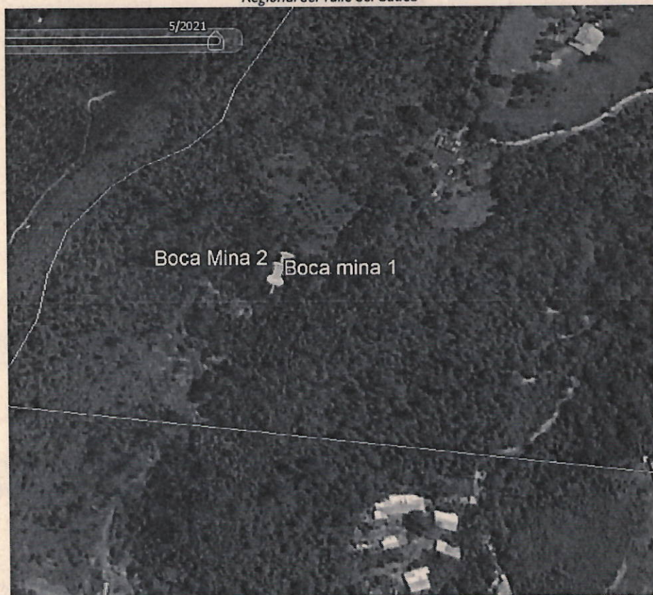
Imagen donde se muestra la ubicación de los puntos según coordenadas de los oficios, y no se observa vivienda alguna ( mayo 2021) .

Corporación Autónoma Regional del Valle del Cauca