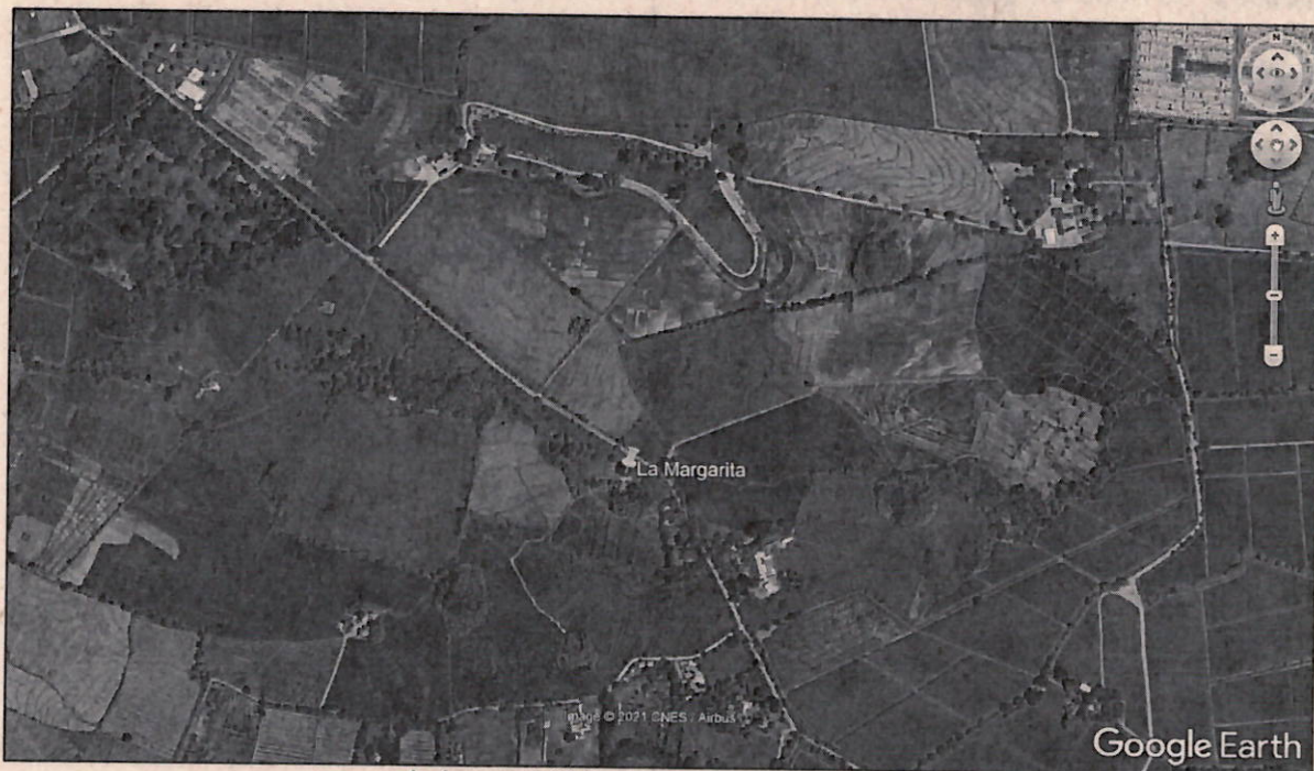
Imágenes 1. Ubicación predio La Margarita

El Predio conocido como LA MARGARITA, se encuentra ubicado en el corregimiento de Paso la Bolsa, entrando por el sector de las piñas en las coordenadas geográficas 03°13'00.060"N, 076°31'37.115"W y planas X (Este): 1.061.189, Y (Norte): 847.470, Imagen 1.