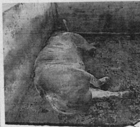
Fotos 2 y 3: Animales de ceba y cerdeja de cría. Eliécer Velasco. CVC. 2020.