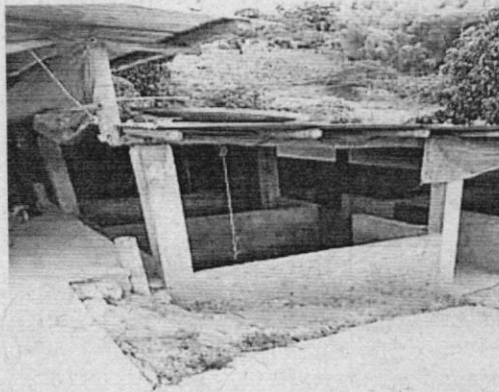
Foto 1. Aspecto general de la porqueriza.

“POR LA CUAL SE IMPONE UNA MEDIDA PREVENTIVA DE SUSPENSIÓN DE ACTIVIDADES Y SE INICIA UN PROCESO SANCIONATORIO AMBIENTAL”