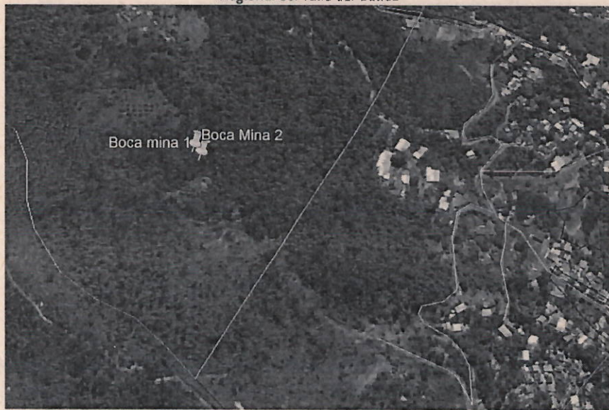
Imagen de ubicación del sitio según coordenadas geográficas encontradas en el acto administrativo.

Corporación Autónoma Regional del Valle del Cauca