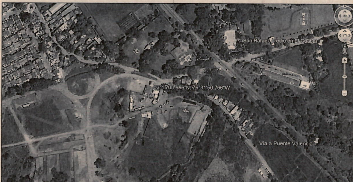
Imagen 1. Ubicación predio El Cairo

El Predio conocido como EL CAIRO, se encuentra ubicado en el corregimiento de Paso la Bolsa, por la vía panamericana, ingresando por una vía que queda al lado opuesto de la entrada a la vereda El Guabal, en las coordenadas geográficas 03^{\circ}15'00.986''N , 76^{\circ}31'50.766''W y planas X (Este): 1.060.766, Y (Norte): 851.184, Imagen 1.