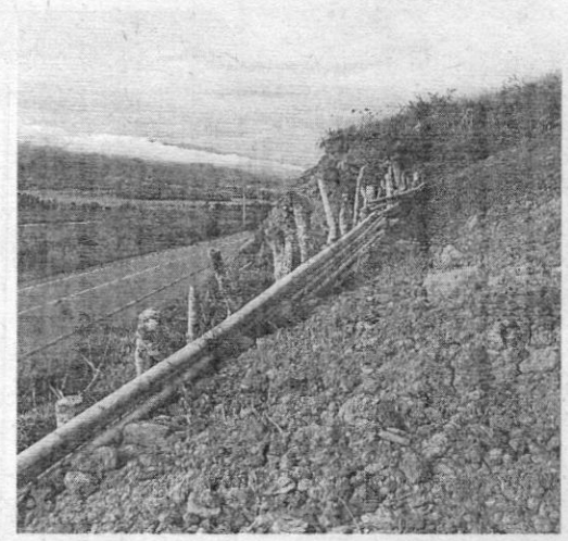
Imágenes 2, 3, 4 y 5: Vía aperturada para el ingreso al Lote 1, vereda Jiguales, Municipio de Calima el Darién.