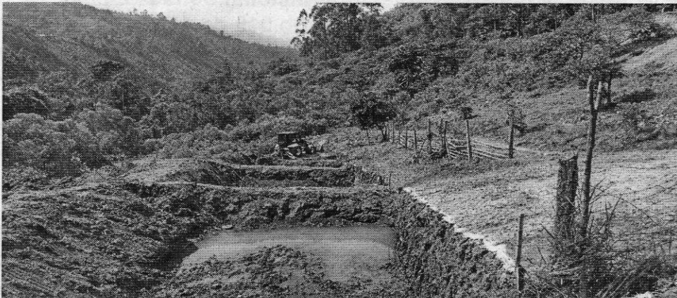
IMAGEN DE LA ZONA FORESTAL PROTECTORA DEL RIO GUABAS- MARGEN DERECHA- OBSERVANDOSE QUE NO PRESENTA AFECTACION CON LA CONSTRUCCION DE LOS ESTANQUES.

VISTA GENERAL DE LOS CUATRO (4) ESTANQUES CONSTRUIDOS Y SU AREA INTERVENIDA CORRESPONDE A ZONA DE POTREROS.