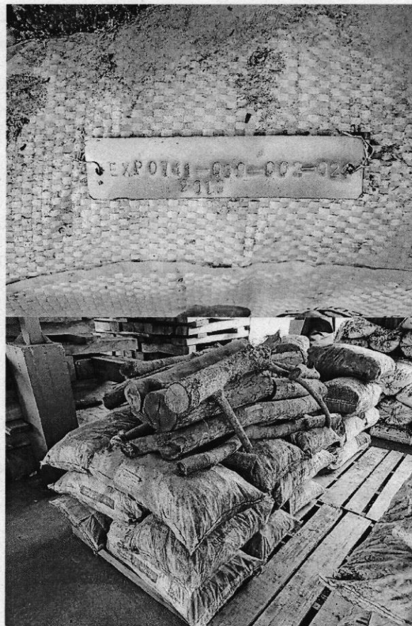
Figura 1 y 2. Material en custodia.

En atención al memorando 0741-634822020 se realiza la verificación de la existencia y la condición de 15 bultos de carbón vegetal, 4 piezas de guacimo ( Guazuma ulmifolia ) equivalentes a 0,007m 3 y 2 piezas de chiminango ( Pitecellobium dulce ) equivalentes a 0,002 m 3 los cuales se encuentran en las instalaciones del CAV de flora de la DAR Centro Sur, bodega 3, en buen estado de conservación.