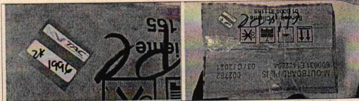
Fotografía 1 nevera de icopor sin destapar.

Se adjunta registro fotográfico de la totalidad del procedimiento.