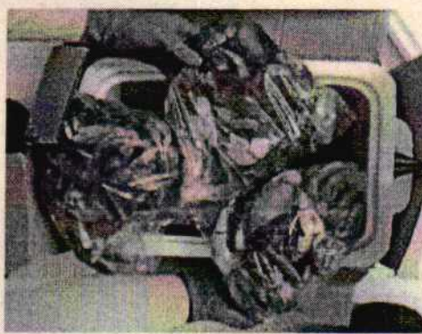
Fotografía 2: Flagrancia de tráfico ilegal.