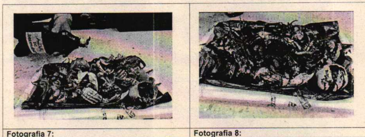
Fotografía 7-8: Proceso de desnaturalización.