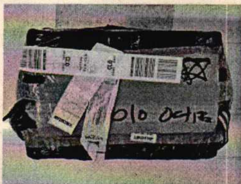
Fotografía 1: nevera de icopor sin destapar.

Se adjunta registro fotográfico de la totalidad del procedimiento.