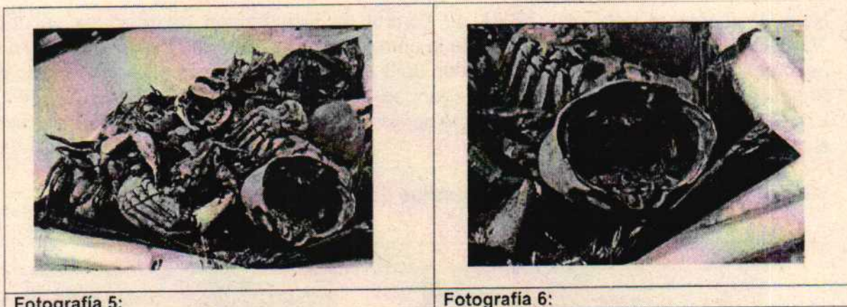
Fotografía 5-6: Proceso de rebanado.

"POR LA CUAL SE LEGALIZA UN ACTA DE IMPOSICIÓN DE MEDIDA PREVENTIVA"