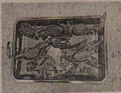
Fotografía 5 flagrancia.