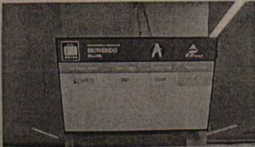
Fotografía 1 Numero de vuelo.

Se adjunta registro fotográfico de la totalidad del procedimiento.