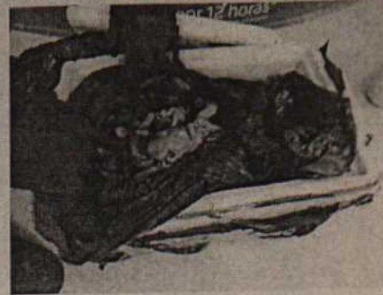
Fotografía 4 Cava destapada.