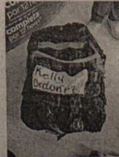
Fotografía 2 Cava cerrada.