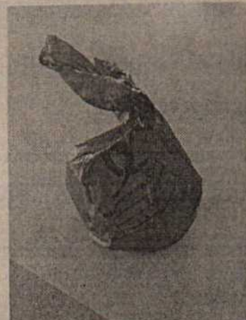
Fotografía 6 Disposición de especímenes en bolsa roja