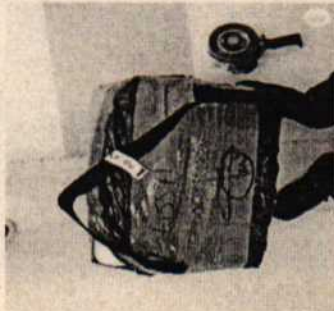
Fotografía 1: nevera de icopor sin destapar