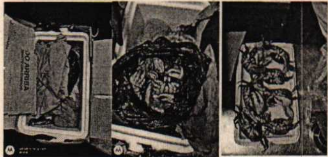
Fotografía 2: Flagrancia de tráfico ilegal.