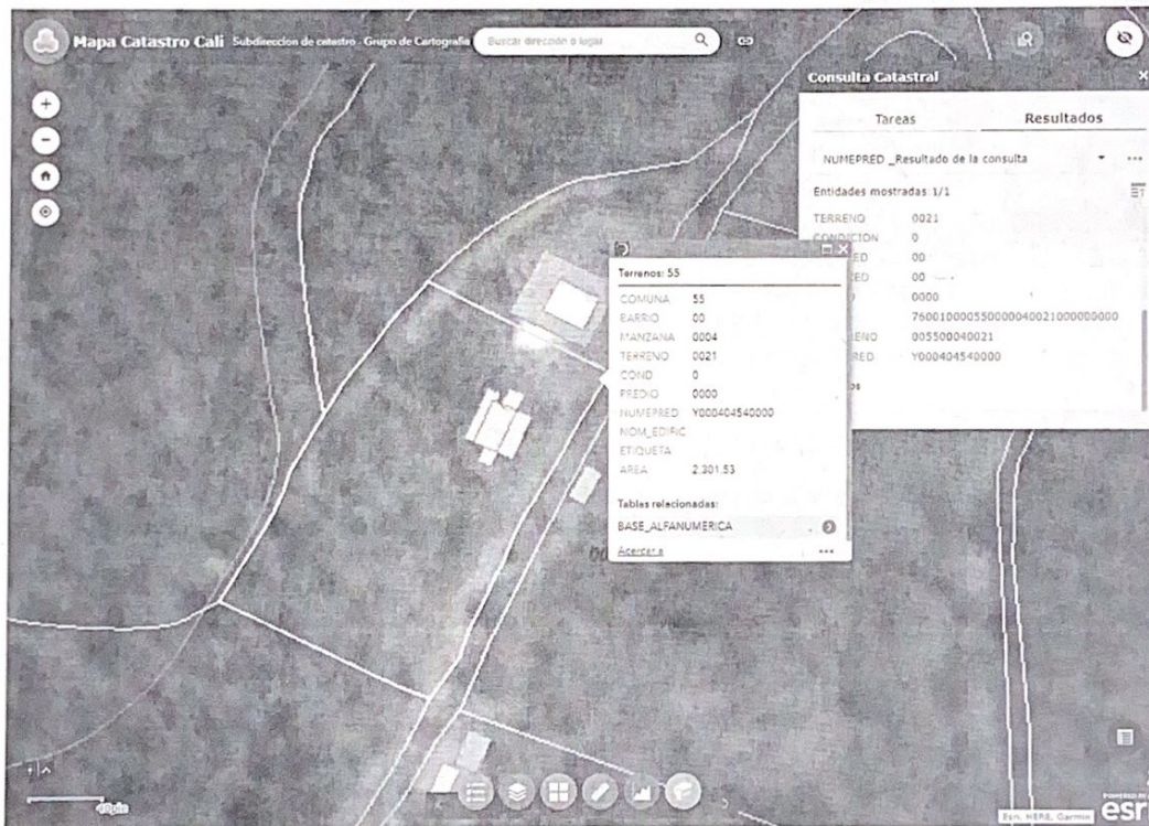
Fotografía 1: ubicación del predio SN.

Coordenadas geográficas: N 3°23'23.81 W 76°36'29.50" del sistema de referencia Magna Sirgas WGS_84.