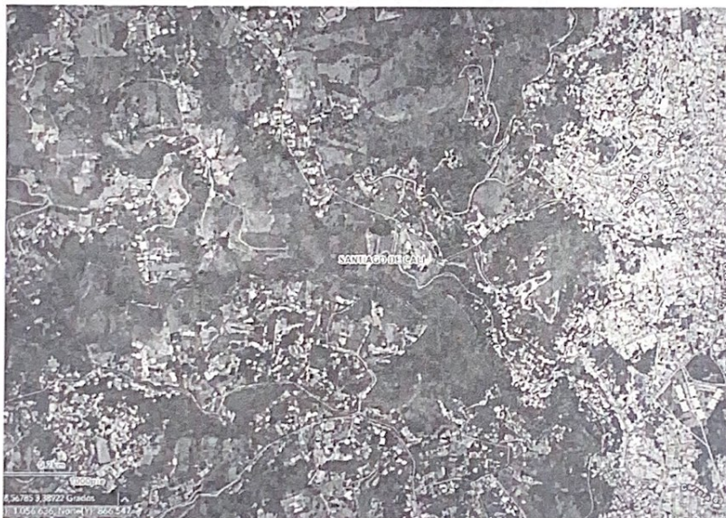
Mapa 1. Ubicación del lugar de la visita, Corregimiento La Buitrera, Sector La Luisa.

Jurisdicción especial del distrito de Cali, Corregimiento La Buitrera, Callejón Las Terrazas, Sector La Luisa, con coordenadas geográficas Latitud: 3.387870°N Longitud: 76.569310°O.