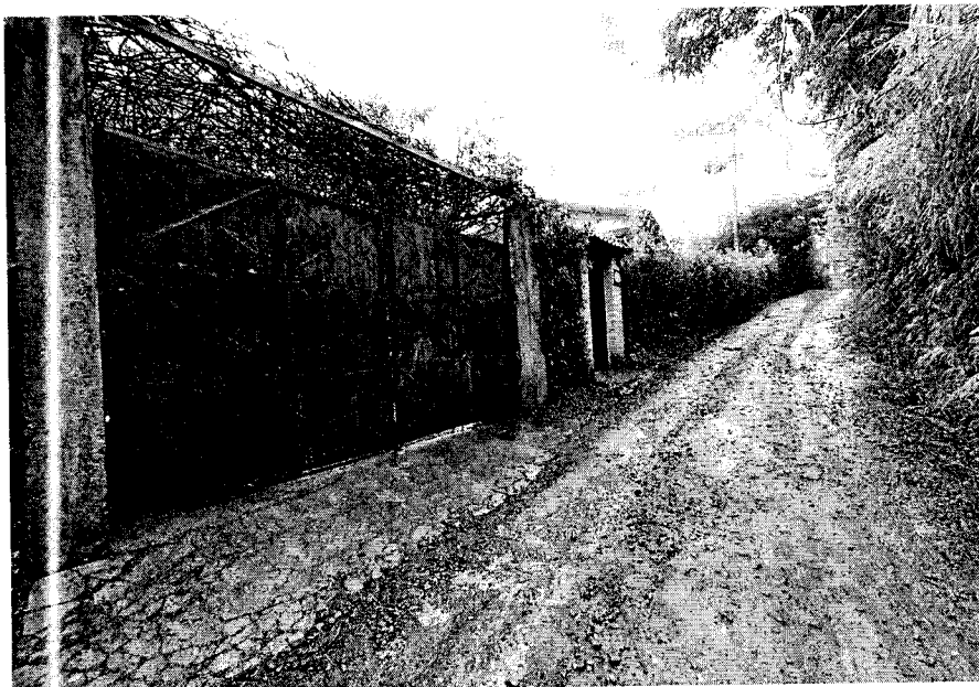
Imagen. Corregimiento La Buitrera, Sector Palma 1.