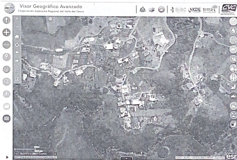
Mapa 1. Ubicación del lugar de la visita, Corregimiento La Buitrera, Callejón Las Terrazas.

Jurisdicción especial del distrito de Cali, Corregimiento La Buitrera, Callejón Las Terrazas, Predio Yarumal, con coordenadas geográficas Latitud: 3.387190°N Longitud: 76.576240° O (Planas X= 1.055.704 Y= 866.322).