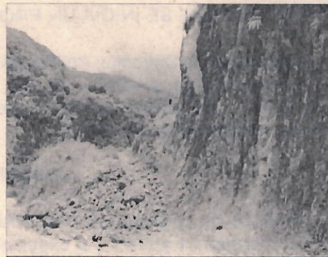
Imagen 5. Desprendimientos de rocas saprolíticas sobre la vía principal del Corregimiento de San Vicente

7. OBJECIONES: No hubo objeciones al momento de la visita.