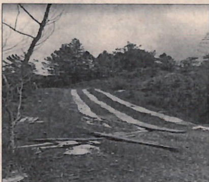
Imagen 3. Vía con placa huella y canales interseccionados