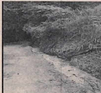
Imagen 4. Cuneta en tierra de sección irregular que conduce el agua excedente hacia la vía principal