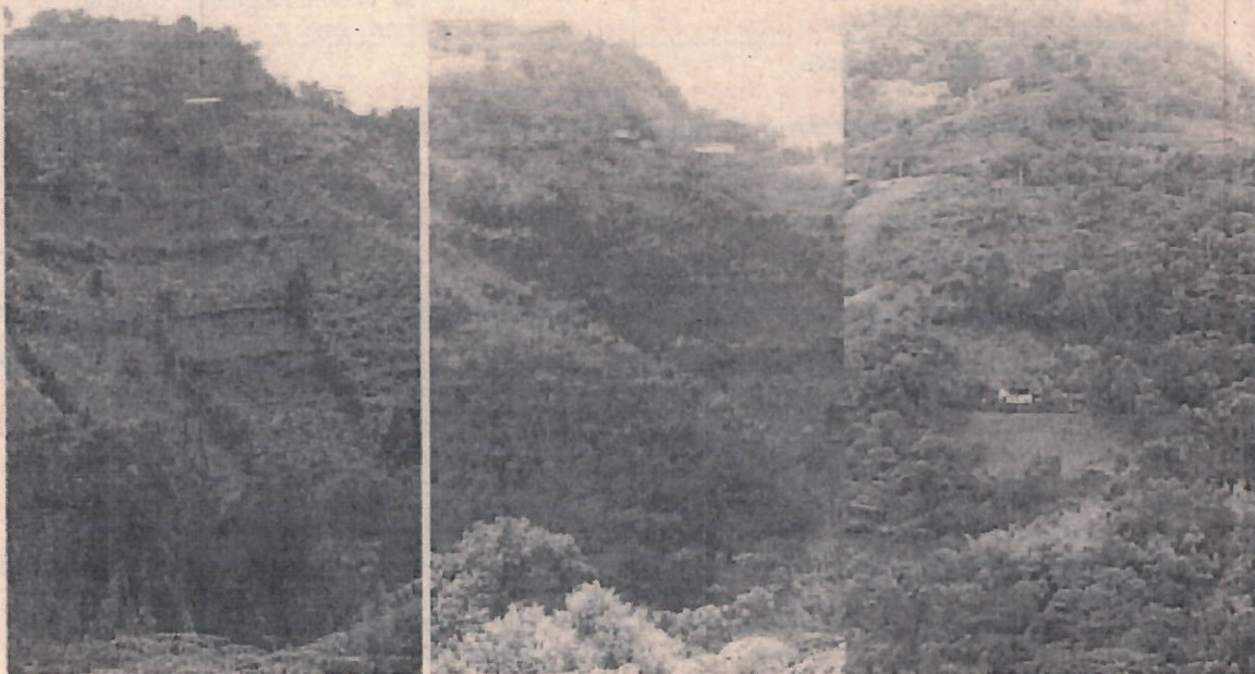
Fotos 1 2 y 3: Se evidencia la limpieza de las lomas afectadas para la implementación de cultivos limpios ya establecido.