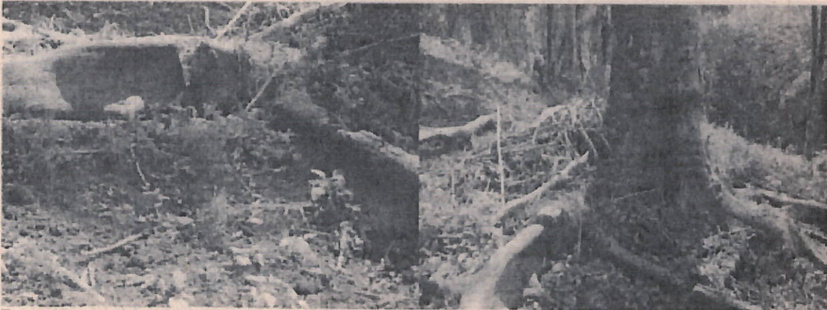
Fotos: 12 y 13: Corte de Raiz para la desestabilización de árboles por encima de los 15 m de altura.