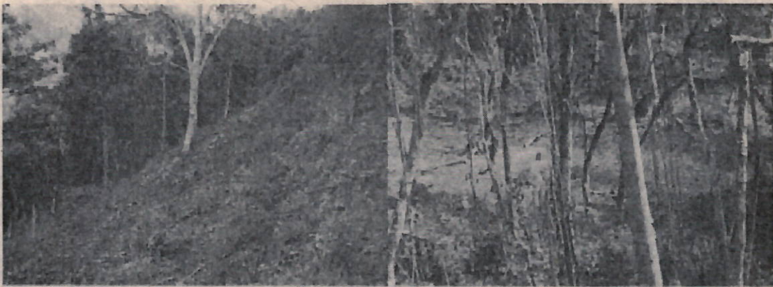
Fotos 4 y 5: limpieza de zona con material forestal para implementación de cultivos.

"POR LA CUAL SE DECIDE UN PROCEDIMIENTO SANCIONATORIO AMBIENTAL"