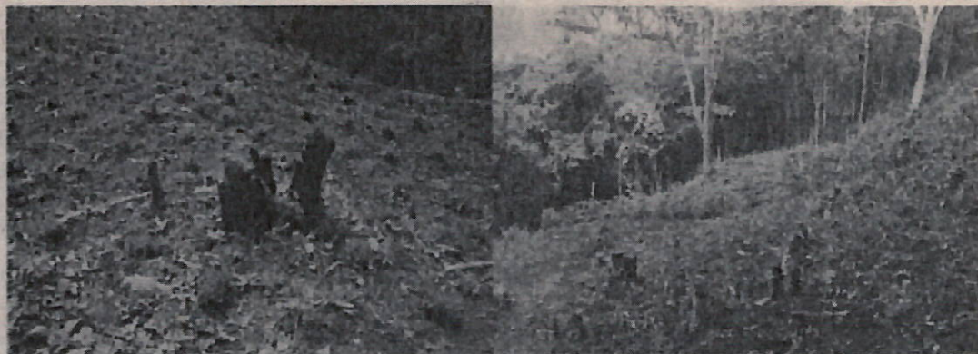
Fotos 8 y 9: tala indiscriminada del bosque para la implementación de cultivos limpios.