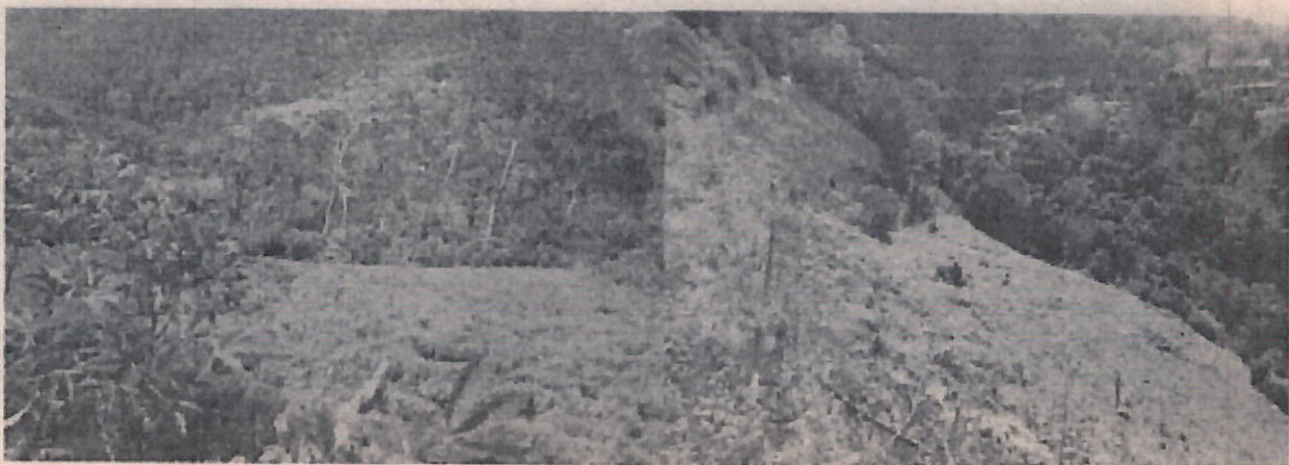
Fotos 14 y 15: Algunos cultivos limpios como de romero v Espinaca implementados