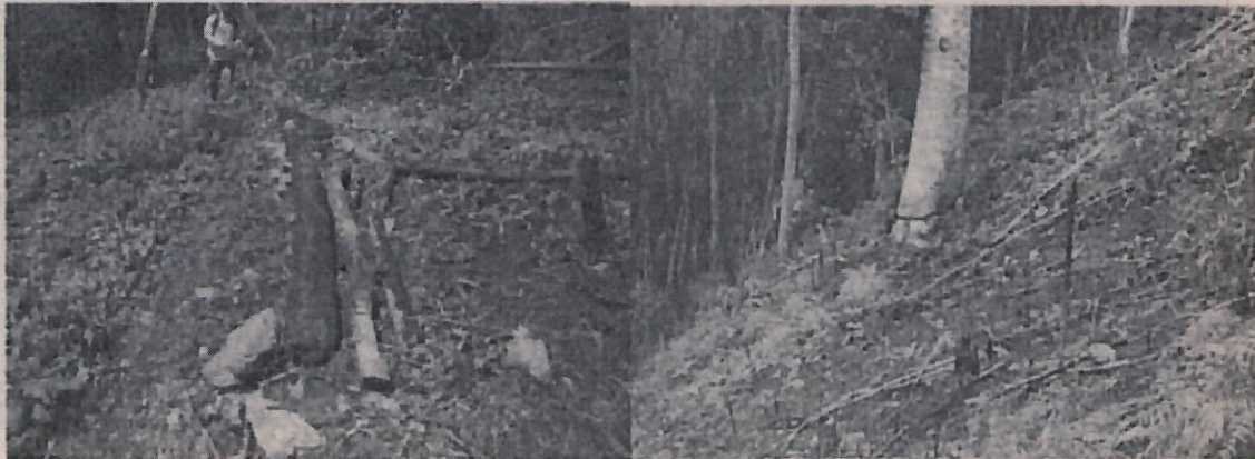
Fotos 10 y 11: Quema de Material Forestal y Bosque para la implementación de cultivos limpios.

"POR LA CUAL SE DECIDE UN PROCEDIMIENTO SANCIONATORIO AMBIENTAL"