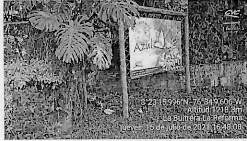
Foto 1. Zona recorrida para entrega de notificación.