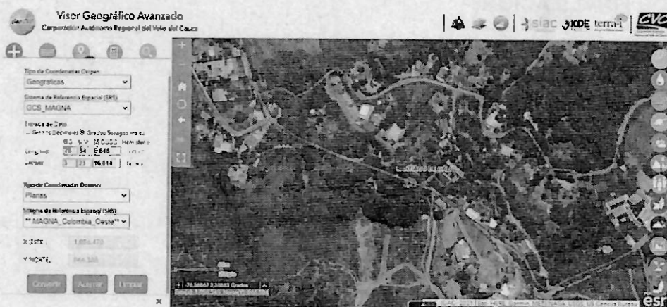
Mapa 1. Ubicación geográfica de la visita realizada.

Jurisdicción del Distrito de Cali, corregimiento de La Buitrera, Sector Mariposario Acuarela, Inmediaciones de las coordenadas geográficas 3^{\circ}23'16,014'' N -76^{\circ}34'09,648'' y Planas X=1056470 E Y=866388 N