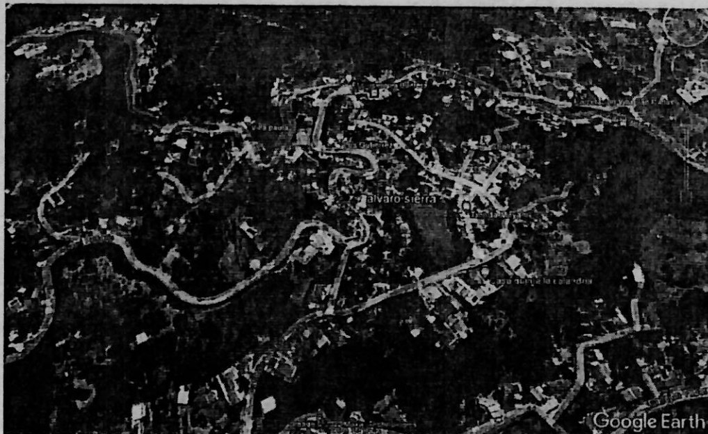
Mapa 1. Ubicación geográfica del lugar de la visita, Km 7.2 El Crucero.

Jurisdicción del distrito de Cali, Corregimiento La Buitrera, Km 7.2 El Crucero, Predio La Sierra. Con coordenadas geográficas Latitud: 3.381180°N Longitud: 76.578180°O.