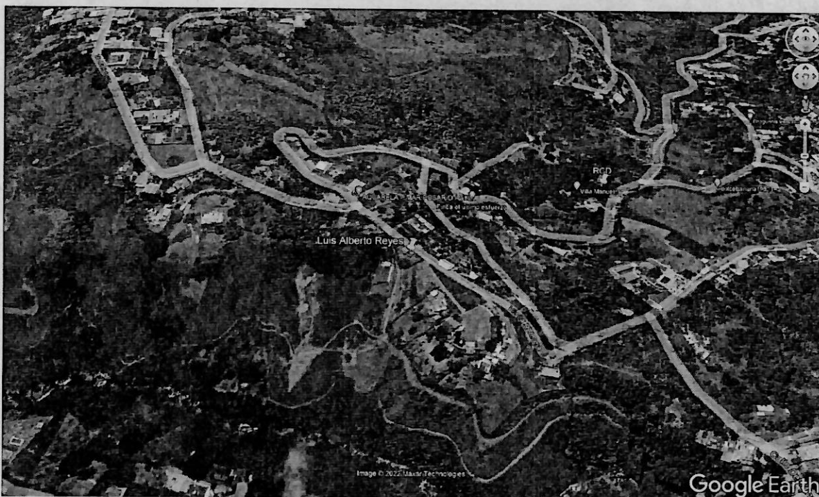
Mapa 1. Ubicación geográfica del lugar de la visita.

Jurisdicción del distrito de Cali, Corregimiento La Buitrera, Callejón El Minero, Sector Mariposario, en inmediaciones con las coordenadas Latitud: 76.568847°N Longitud: 3.387411°O.