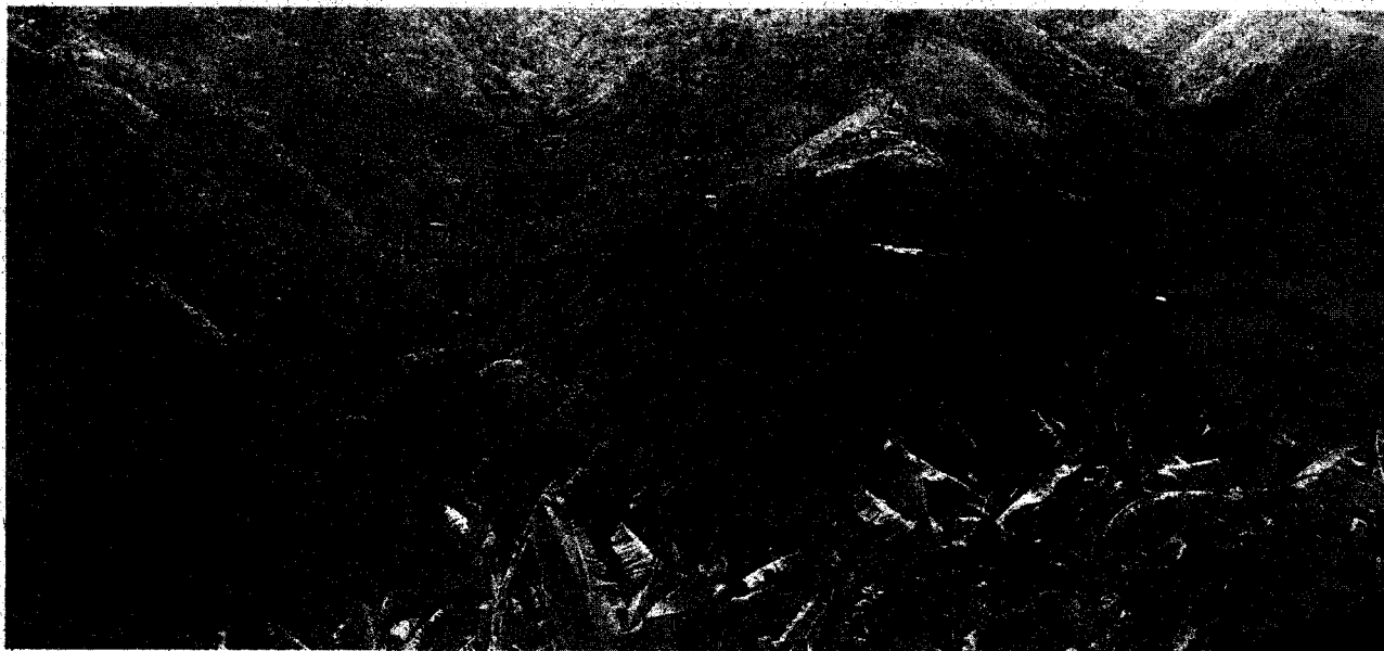
Área que fue intervenida

En la visita técnica, se logró evidenciar que efectivamente en el predio denominado "El Bosque", se han adelantado labores de adecuación de terreno, realizando ampliaciones de la frontera pecuaria, realizando intervenciones de áreas continuas a la zona forestal protectora de un bosque que se encuentra en la parte baja del predio, se hace la claridad en la visita, que estas actividades de ampliación de la frontera agropecuaria, mediante la tala de especies pioneras y rastrojo alto, no se pueden realizar sin la respectiva autorización de la Corporación, para lo cual, se realizó en campo la suspensión definitiva de las actividades de adecuación, haciéndose la claridad que, para continuar con las mismas, debe de tramitar un permiso de adecuación de terreno ante la autoridad ambiental, para este caso, es a través de la Dirección Ambiental Regional Norte de la CVC.