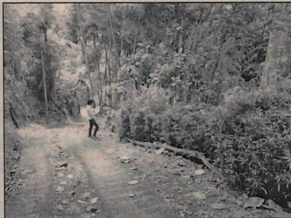
Imagen 1 y 2. Visita al predio indicado en el oficio, en las coordenadas E:1.051.467W, N:875.836, coordenadas geográficas 03°28'23.66"N, 76°36'51.59"W