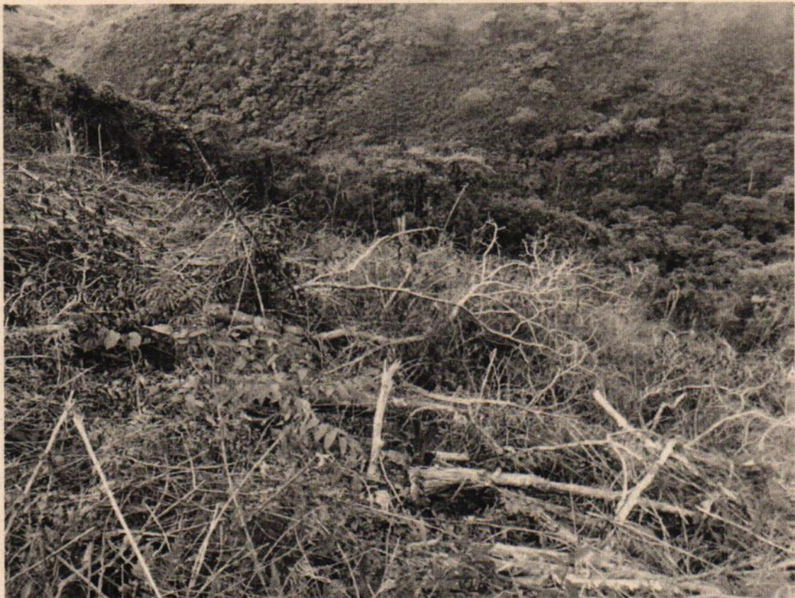
Figura 2. Vista general de área intervenida en predio los robles, corregimiento Los Negros, Florida

Con una aplicación móvil My GPS Coordinates se tomaron coordenadas de cuatro puntos (A, B, C y D) en los bordes del área talada, en google earth se dibujó el polígono conformado por dichos vértices (ver cuadro 1) y se estimó que el área intervenida fue aproximadamente de 5059 m 2 (ver figura 2).