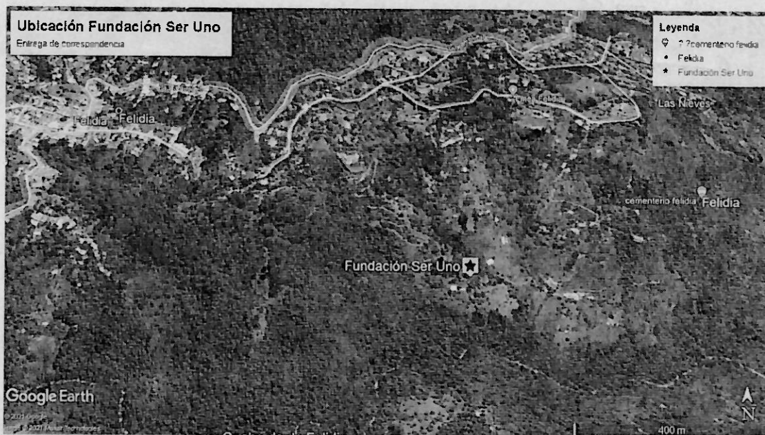
Imagen N° 1. Ubicación del predio las Palmas. (Fuente Googlea Earth).