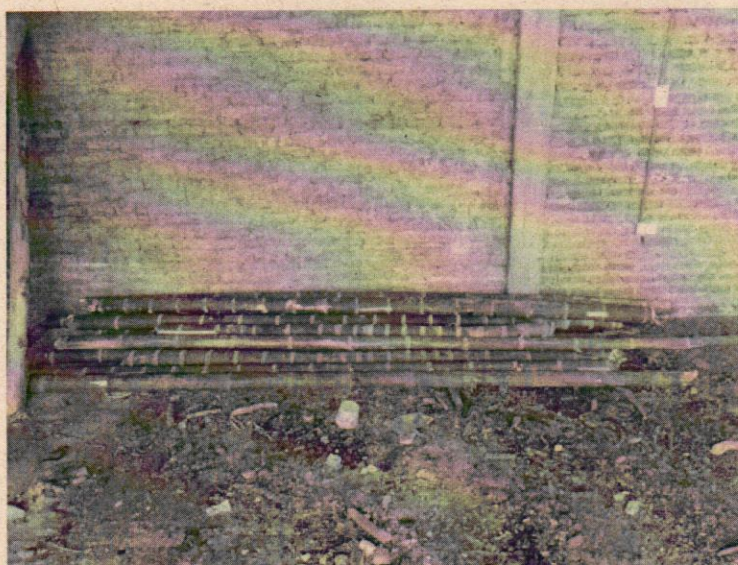
Figura 2. Estado de madurez de guaduas decomisadas

Descripción de la especie: La guadua ( Guadua angustifolia ) es una especie nativa, que pertenece a la familia de la familia Poaceae, la misma, de los pastos. Por esta razón algunas personas la catalogan como un pasto gigante. Es una especie monocotilodonea que requiere abundante luz solar para su crecimiento. Se reproduce primordialmente a través de sus rizomas. Los culmos de la guadua (el equivalente al tallo en los arboles) alcanza altura de hasta 30 m y DAP de 25 cm. Sin embargo, los culmos carecen de cambium, por ende brotan con el diámetro definitivo, es decir, no engrosan durante su ciclo de vida.