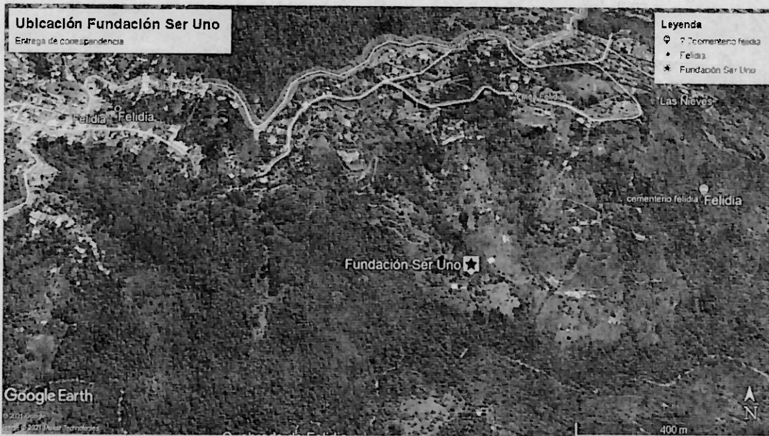
Imagen N° 1. Ubicación del predio las Palmas..