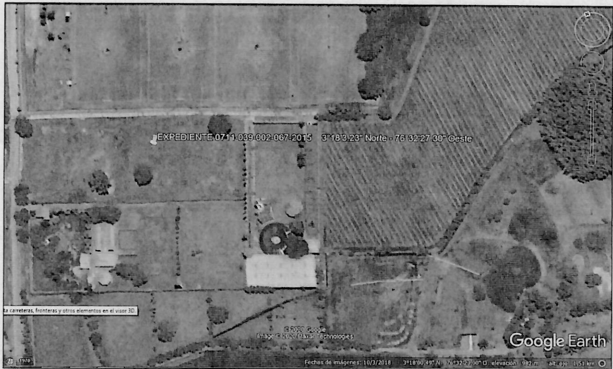
Imagen 1. Ubicación del predio

Predio ubicado en el sector de la Viga, del corregimiento de Pance, jurisdicción del municipio de Cali, al predio se llega tomando la vía que de Cali se llega a Jamundí, luego de pasar el puente de la Viga sobre el Rio Pance, en las coordenadas geográficas 3°18'3.23" Norte - 76°32'27.30" Oeste, al frente del Centro Deportivo Luz Mery Tristán se encuentra el predio.