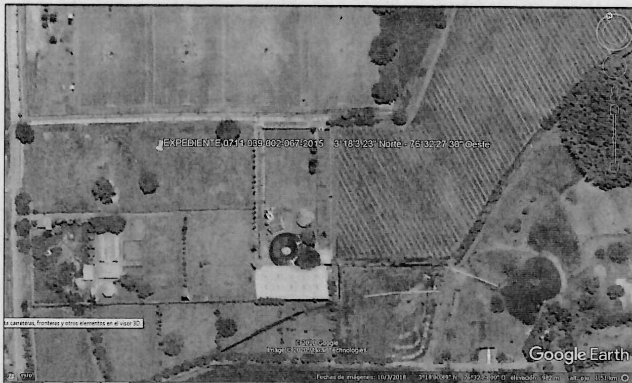
Imagen 1. Ubicación del predio

Predio ubicado en el sector de la Viga, del corregimiento de Pance, jurisdicción del municipio de Cali, al predio se llega tomando la vía que de Cali se llega a Jamundí, luego de pasar el puente de la Viga sobre el Rio Pance, en las coordenadas geográficas 3°18'3.23" Norte - 76°32'27.30" Oeste, al frente del Centro Deportivo Luz Mery Tristán se encuentra el predio.