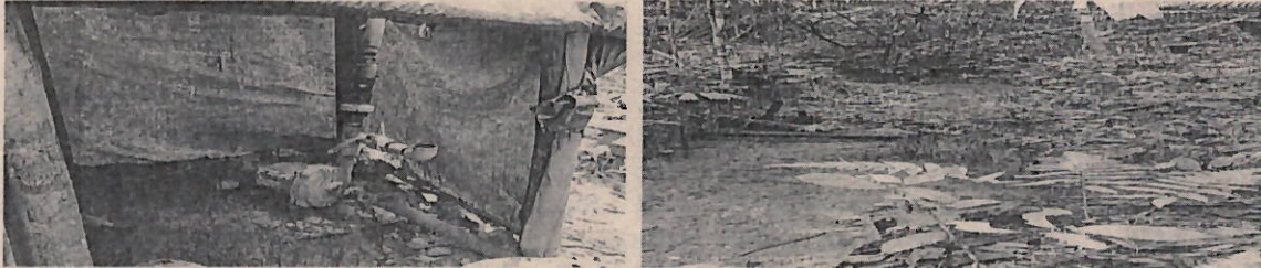
Fotos 4 y 5. Motobomba y quebrada para la captación de Agua.

La captación de agua para las actividades de aseo y cocina se realiza desde una quebrada localizada en el predio, mediante un sistema de bombeo utilizando una manguera y una motobomba de 3 hp la cual lleva el agua a unos tanques de almacenamiento con una capacidad de 7000 litros, también se abastece de las aguas lluvias de acuerdo a lo manifestado por el representante legal cuando la capacidad del hotel está al 100% de utilización el consumo promedio por día son 7000 litros.