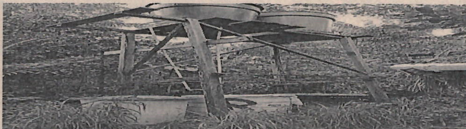
Foto 6. Tanques de almacenamiento de agua, Capacidad 7000 litros, Hotel Casa Azul.

Después de esta revisión se procedió a solicitarle la documentación que ampara los derechos ambientales de permiso de vertimiento y concesión de agua superficial, de acuerdo a la normatividad vigente, (Decreto 1076 de 2015, ley 99 de 1993; entre otras) a lo cual el administrador manifestó que no contaba con ellos.