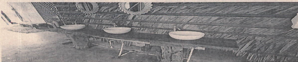
Foto 3. Lavamanos zona de baños comunes, Hotel Casa Azul.