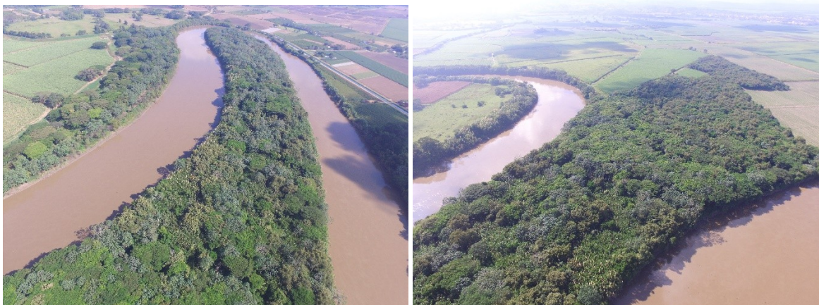
Fuente: CVC, 2022. Figuras 10 y 11 del documento síntesis (pág. 13).

El documento síntesis evidencia la pertinencia de la declaratoria del Área de Recreación La Córcova, pues esta se sustenta correctamente en criterios biofísicos, socioeconómicos y culturales, y se justifica como estrategia para mantener la función de los bosques secos en proceso de recuperación, conservar especies con valor ecológico y proveer espacios naturales aptos para la valoración social local, como se sustenta a continuación.