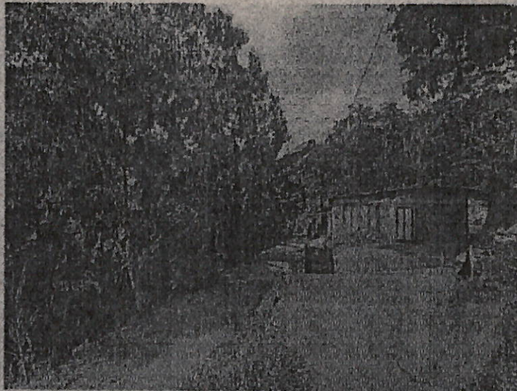
Imagen. Ubicación del lugar de la visita, Callejón Mirador, Paraje La Luisa.