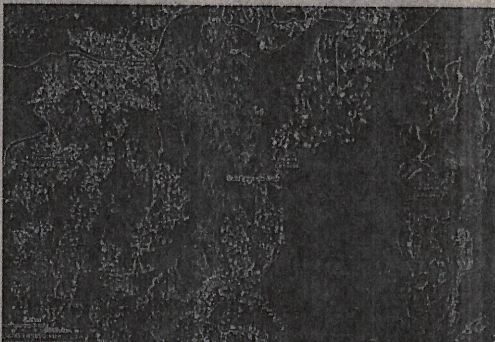
Mapa 1. Ubicación geográfica del lugar de la visita, Corregimiento La Buitrera.

Jurisdicción del distrito de Cali, Corregimiento La Buitrera, Paraje La Luisa, Callejón Mirador, en inmediaciones con las coordenadas Latitud: 3.403441^{\circ}\text{N} Longitud: 76.568643^{\circ}\text{O} (Planas X= 1.056.548 Y= 868.120).